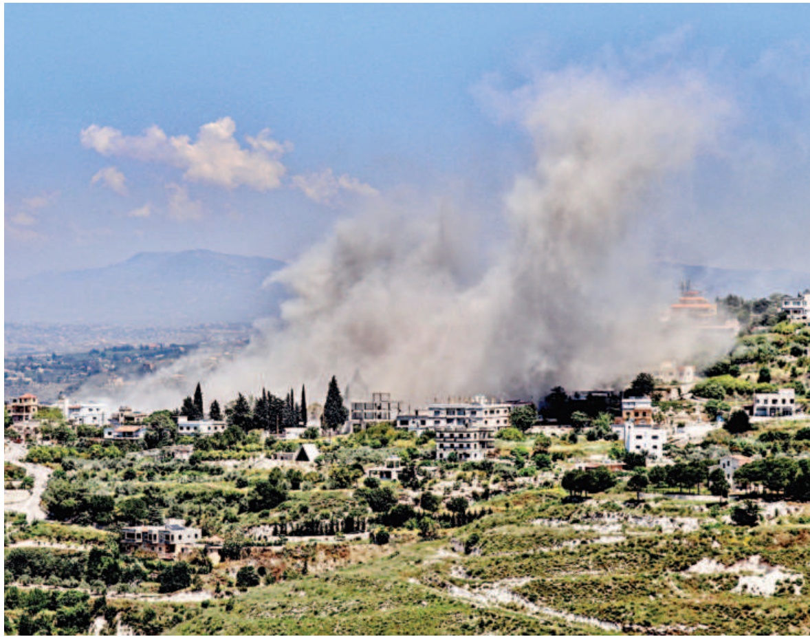
Smoke rises from the site of an Israeli airstrike on the southern Lebanese village of al-Halloussiyah yesterday.

"I am not going to walk away," he told reporters in Ealing, west London, where Labour retained control of the council. He said voters were more concerned about the pace of change rather than his leadership.