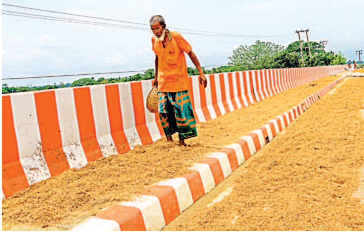
An elderly farmer is drying paddy on the bridge over Mohashing river in Joykolosh area of Sylhet-Sunamganj highway as the sun comes through after days of rain. With most fields and drying grounds still waterlogged, farmers are being forced to use any available space to save their harvest. The photo was taken yesterday.