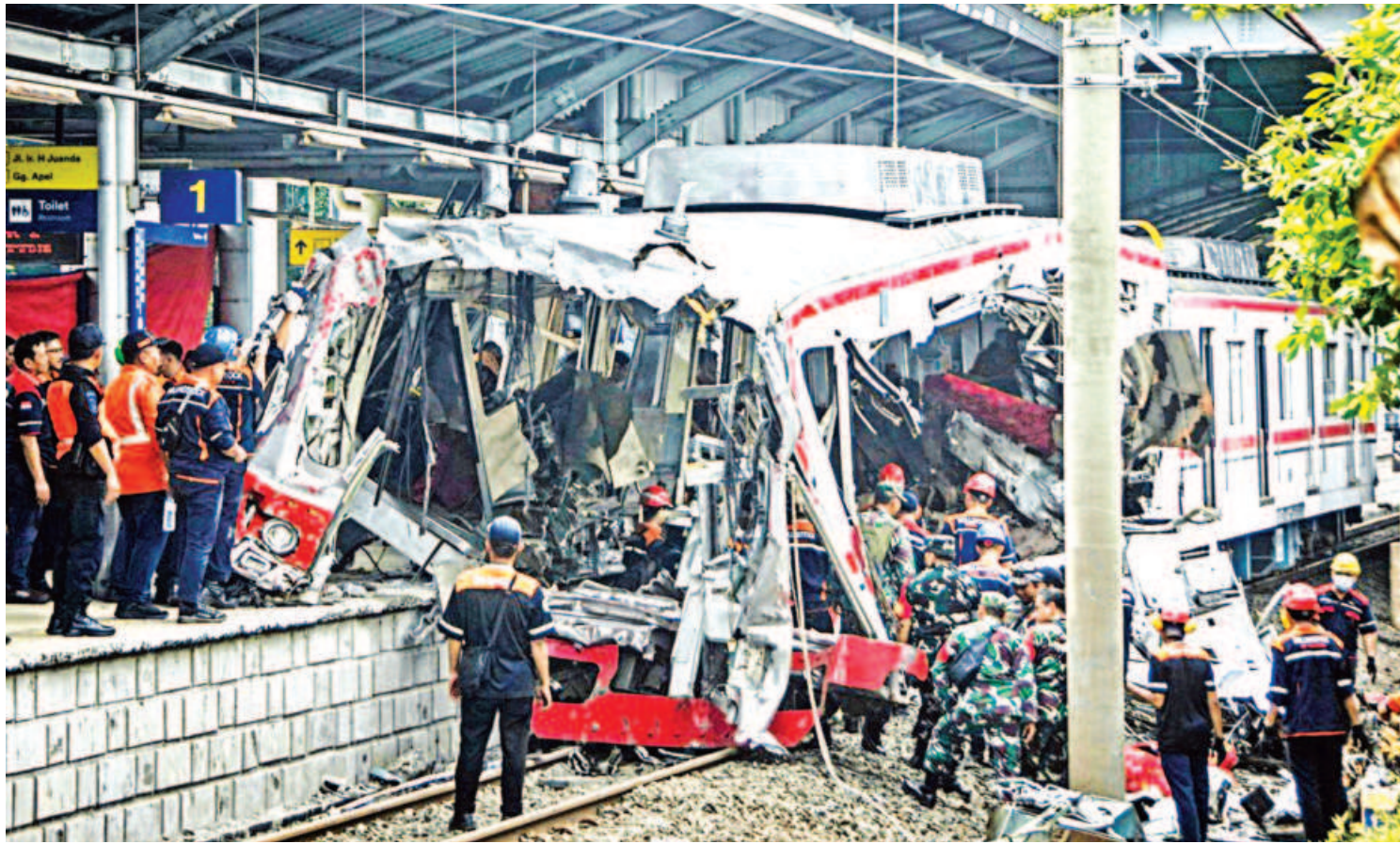
Workers clear debris at the train collision site after the locomotive of a passenger train pierced through the rear car of a commuter train at Bekasi Timur Station in Bekasi, West Java, yesterday. The incident killed at least 15 people and injured dozens.

At least 800 Palestinians have been killed since the October 2025 ceasefire, according to local medics, while Israel says attacks have killed four of its soldiers over the same period.