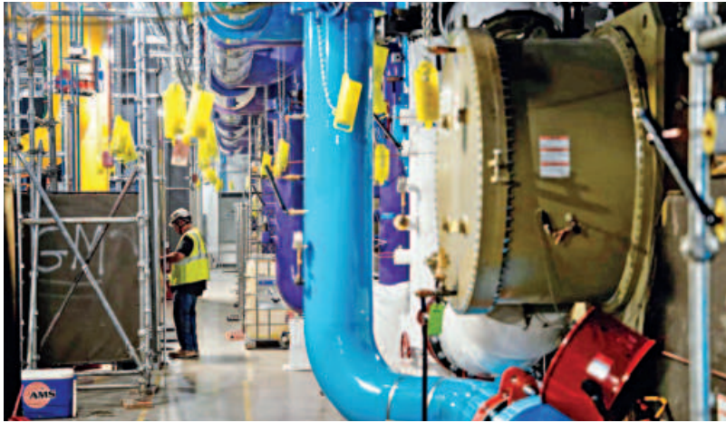
A person works inside the Microsoft data center campus' Graphical Processing Unit, currently under construction in Mount Pleasant, Wisconsin, US.

Big technology companies pinning their futures on AI are tapping deep pools of money. Alphabet, Amazon.com, Meta Platforms, Microsoft and Oracle have already committed significant amounts and, theoretically at least, have even more at their disposal. Combined, the liveness is expected to generate $5.5 trillion of operating cash flow from selling software subscriptions, advertising, cloud storage and other goods and services over the next five years, according to estimates gathered by Visible Alpha.