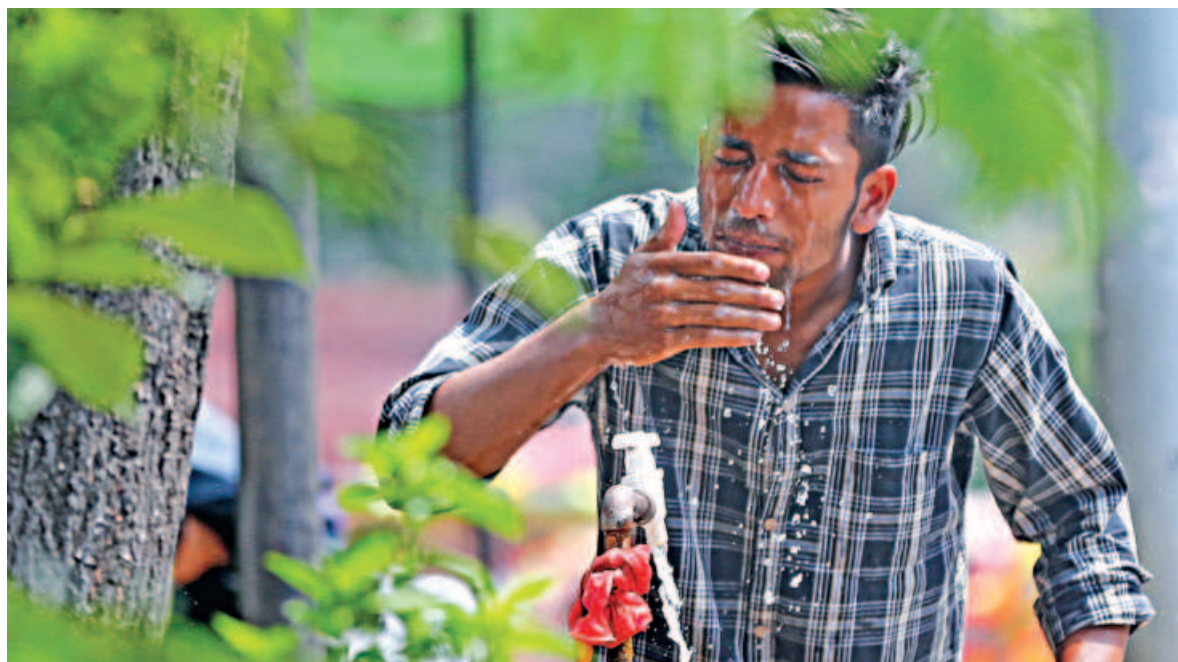
A man splashes water on his face to cope with the sweltering midday heat at TSC on the Dhaka University campus yesterday. With Baishakh beginning next week, the heat is only set to intensify.

The victim's family has demanded a proper investigation to find the cause of death and hold the culprits accountable.