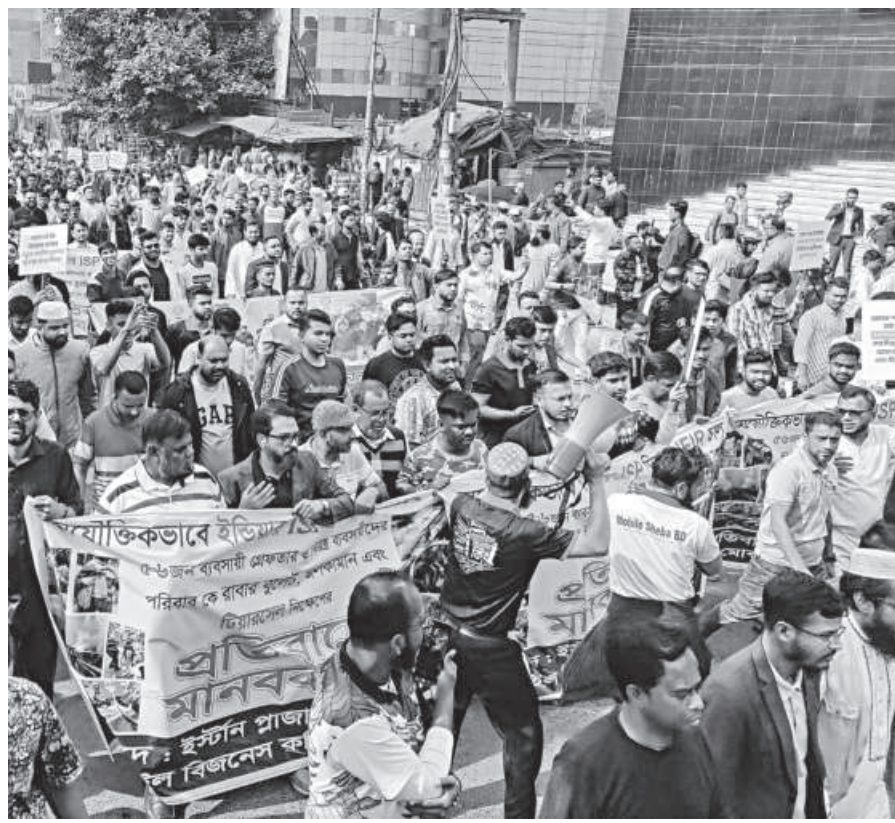
Mobile phone traders bring out a procession in the capital's Panthapath area yesterday, demanding a postponement of the implementation of the National Equipment Identity Register (NEIR) system and the release of colleagues arrested over protests against the initiative.