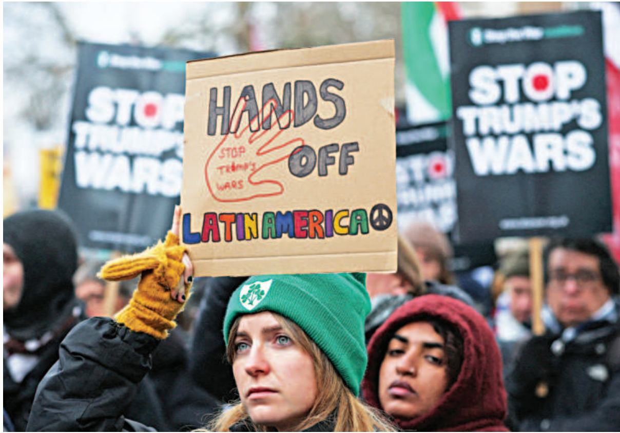
Anti-war activists hold placards during a rally against the US aggression on Venezuela outside Downing Street in London, Britain, yesterday.