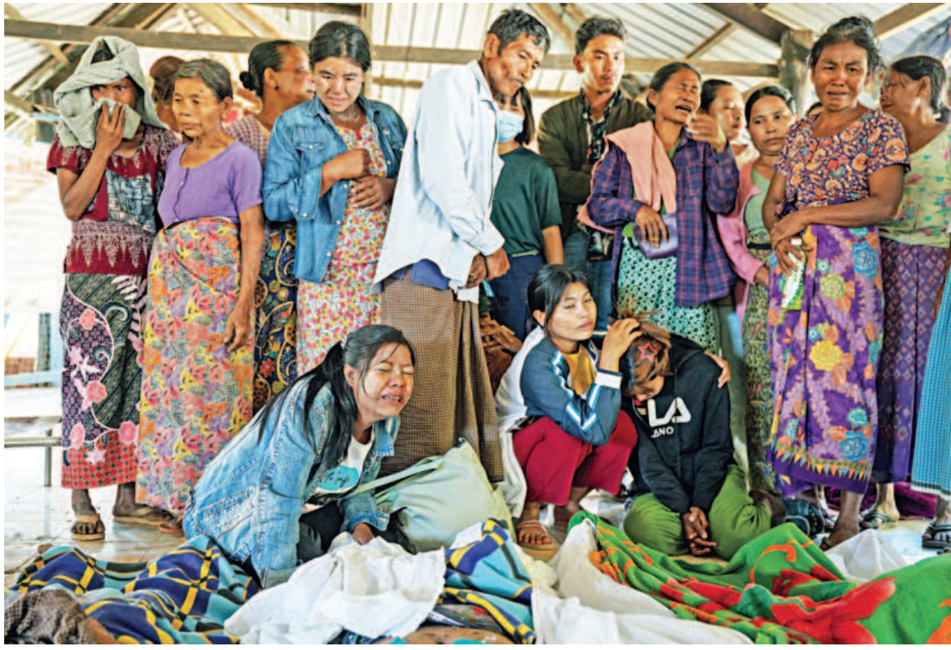
Mourners grieve as bodies are laid out at a cemetery before burial, following a Myanmar military air strike on a hospital that killed more than 30 people in Mrauk U in western Rakhine state yesterday.

Meanwhile, Russia shot down nearly 300 Ukrainian drones overnight, one of Kyiv's largest attempted attacks of the four-year war and a barrage that forced Moscow airports to temporarily close, Russian officials said yesterday.