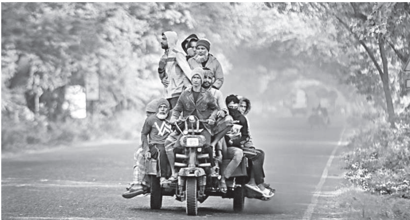
Daily-wage workers from nearby villages in Khulna brave the early winter chill and travel to the city on a makeshift three-wheeler, locally called a Nosimon. Depending on the type of work they find, labourers earn Tk 500 to 700 per day. The photo was taken at Akmaner Mor on the Bypass Road yesterday.

Contacted, Bagerhat Local Government Engineering Department Executive Engineer Md Sharifuzzaman said they are aware of the issue and necessary action will be taken soon.