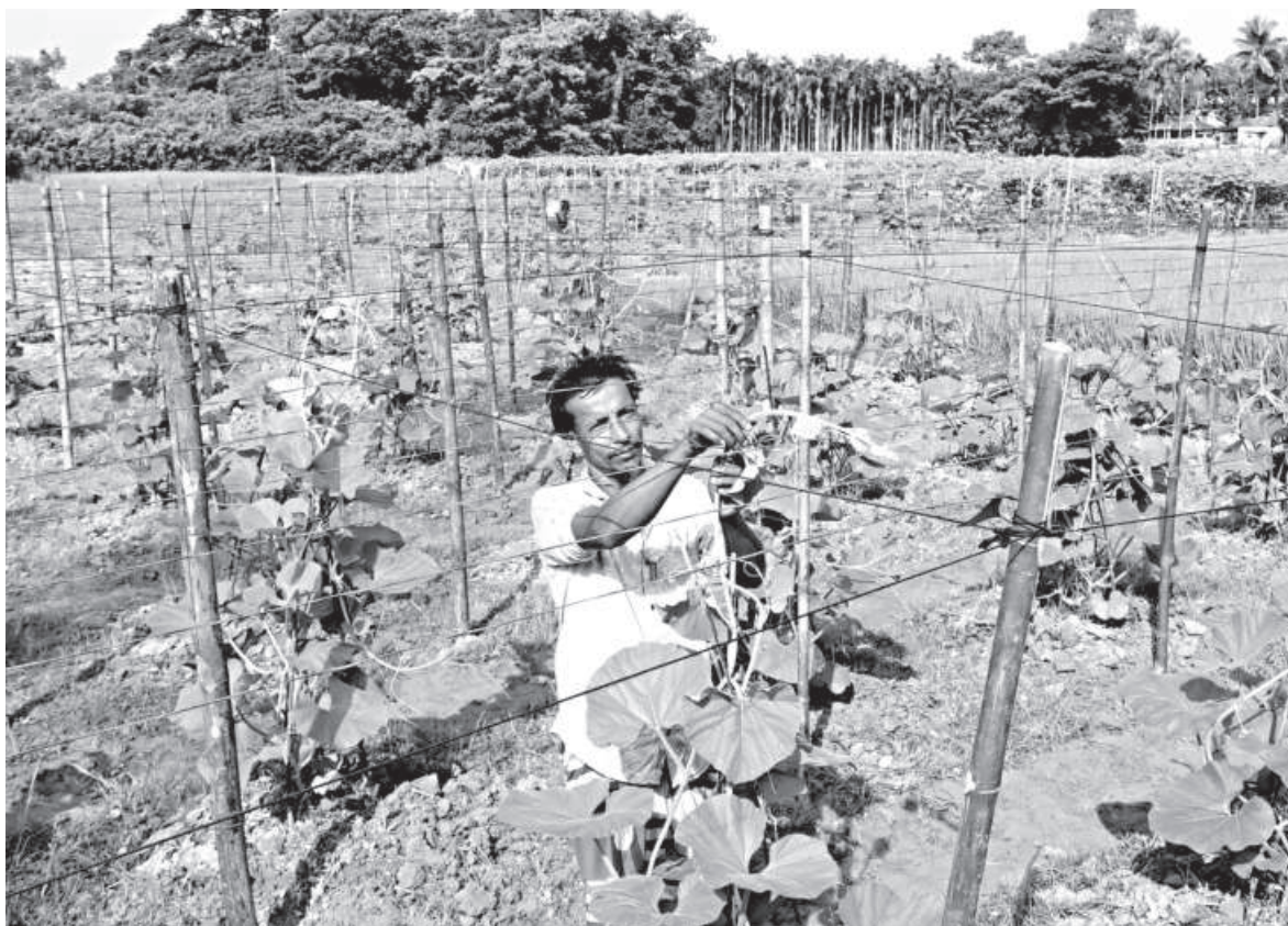
A farmer takes care of his bottle gourd plants in Sylhet. Across Dakshin Surma upazila, farmers have started planting cucumbers, tomatoes, cauliflowers, and red spinach ahead of the winter season. The photo was taken in the Kamalbazar area recently.