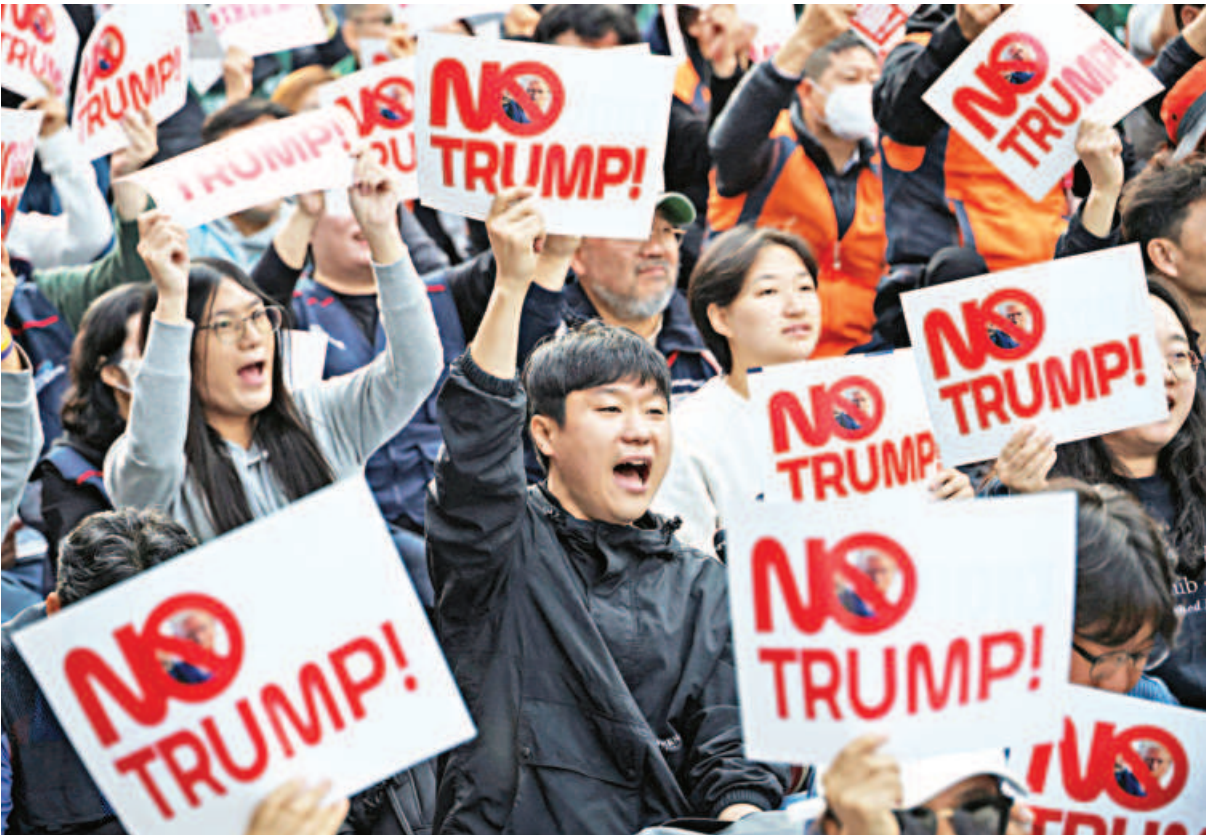
Protesters hold signs as they attend an anti-Trump rally against US President Donald Trump’s tariff policy ahead of his visit to South Korea for the APEC summit, in Seoul, South Korea, yesterday. Trump headed to Asia for high-stakes trade talks with Chinese President Xi Jinping, saying he would also like to meet North Korean leader Kim Jong Un during the trip.

AFP, Washington The Pentagon on Friday ordered the deployment of an aircraft carrier strike group to counter drug trafficking organizations in Latin America, a major escalation of a US military buildup that Venezuela’s leader warned was steered at “fabricating a war.” US President Donald Trump, who campaigned on a promise of ending foreign military interventions, in early September launched a military campaign targeting boats allegedly used to smuggle narcotics, destroying at least 10 vessels in a series of strikes. But the American military buildup as part of that campaign -- including 10 F-35 stealth warplanes and eight US Navy ships -- has sparked fears in Venezuela that Washington’s ultimate goal is the overthrow of President Nicolas Maduro, and the decision to send the carrier is certain to add to those concerns. Late Friday, Maduro accused the Trump administration of stoking “a new eternal war.” The US-Venezuela standoff has also pulled in Colombia’s Gustavo Petro, a sharp critic of the American strikes who was sanctioned by Washington on Friday for allegedly allowing drug trafficking to flourish.