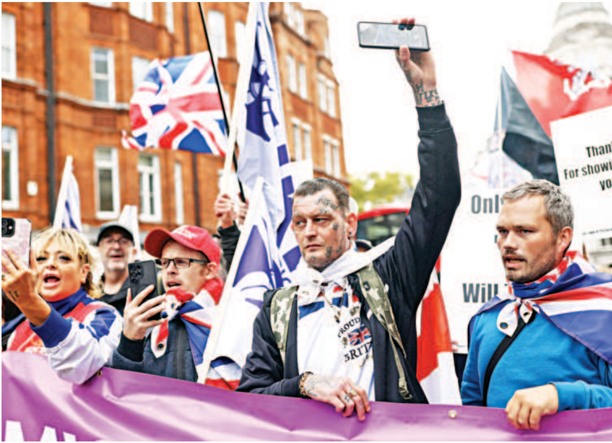
People hold a banner as they gather to attend a United Kingdom Independence Party (UKIP) anti-immigration march in central London, Britain, yesterday.