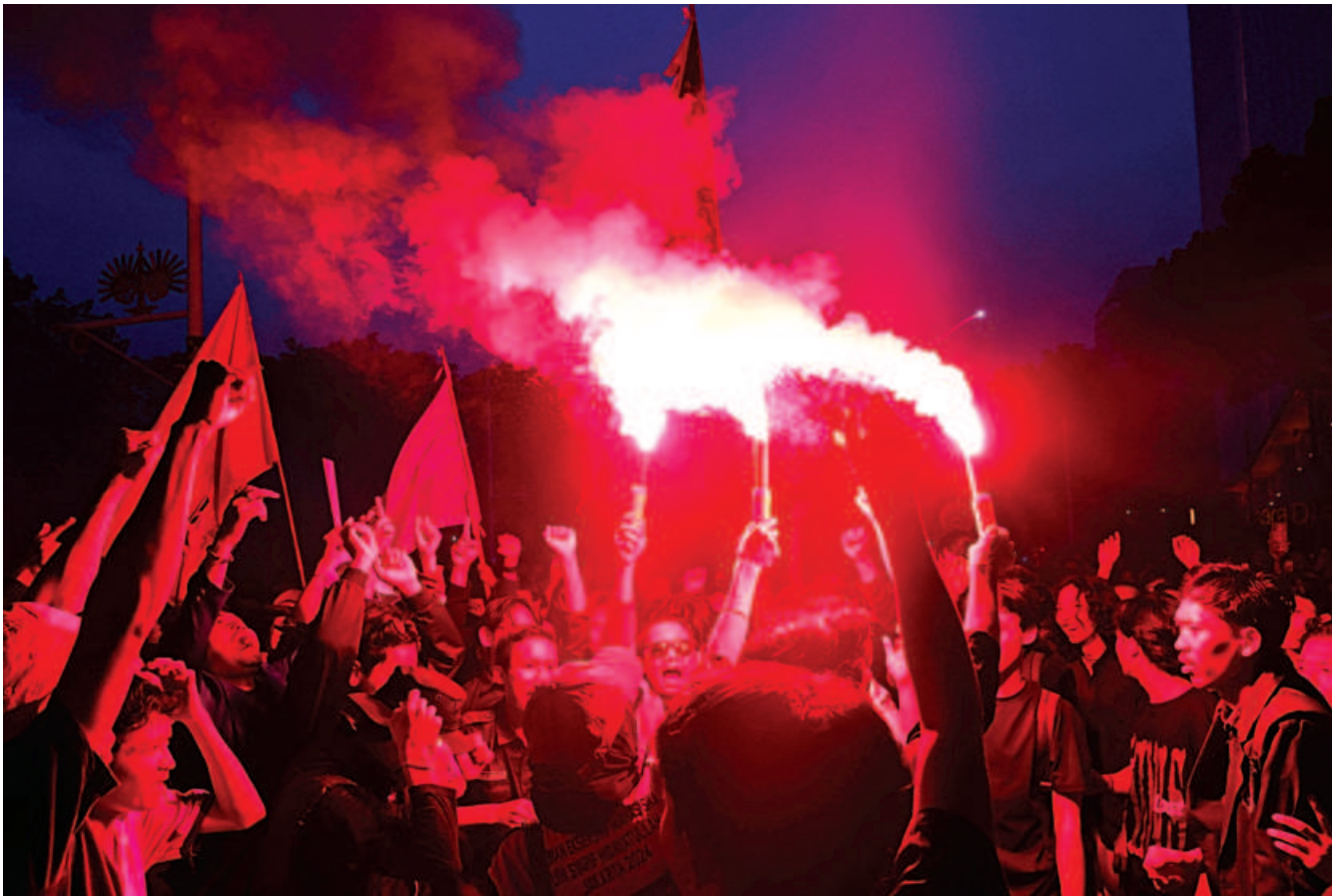
University students light flares during a protest marking the first anniversary of Indonesian President Prabowo Subianto’s administration, criticising government policies—particularly the free meals program—in Jakarta, Indonesia, yesterday.

In comments to media at a meeting on Sunday and cleared for use yesterday, Zelensky said the systems would be supplied every year for a number of years, and that Ukraine would seek for some European nations to give Kyiv priority in the queue for the systems.