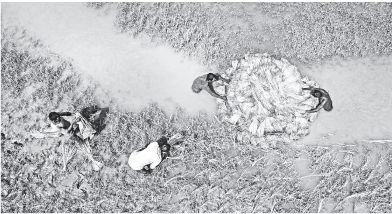
Farmers float paddy seedlings on tidal waters to carry them to the fields for planting, a method that reduces physical labour. The photo was taken at Chak Shailmari village in Batiaghata upazila of Khulna yesterday.