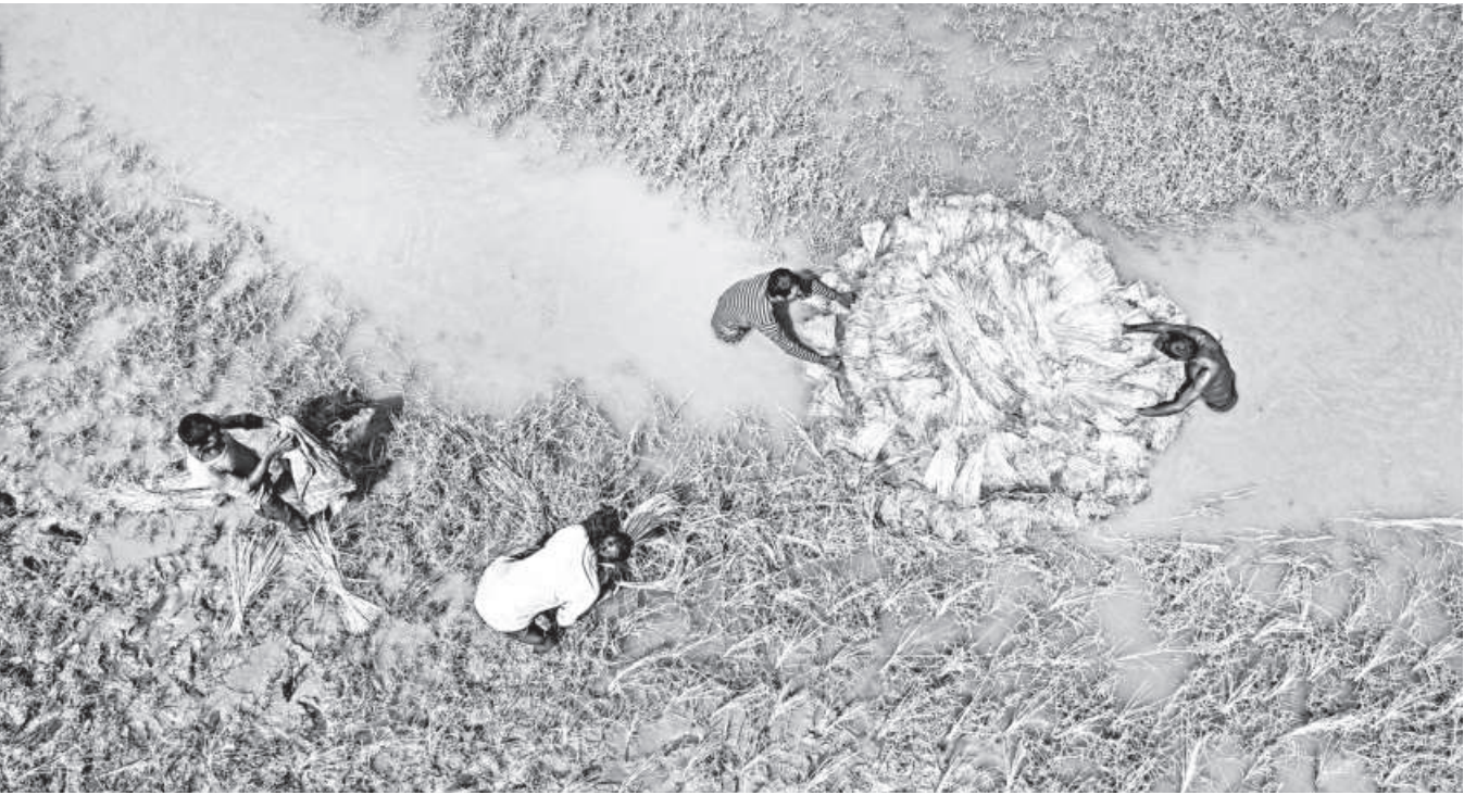
Farmers float paddy seedlings on tidal waters to carry them to the fields for planting, a method that reduces physical labour. The photo was taken at Chak Shailmari village in Batiaghata upazila of Khulna yesterday.