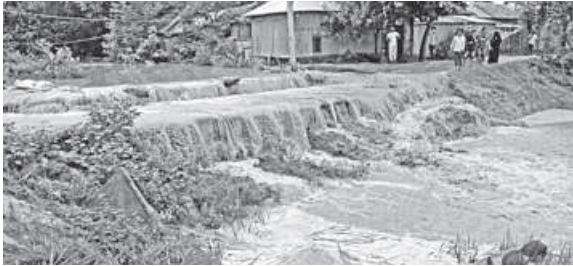
People wading through floodwaters in Jhenaigati of Sherpur.