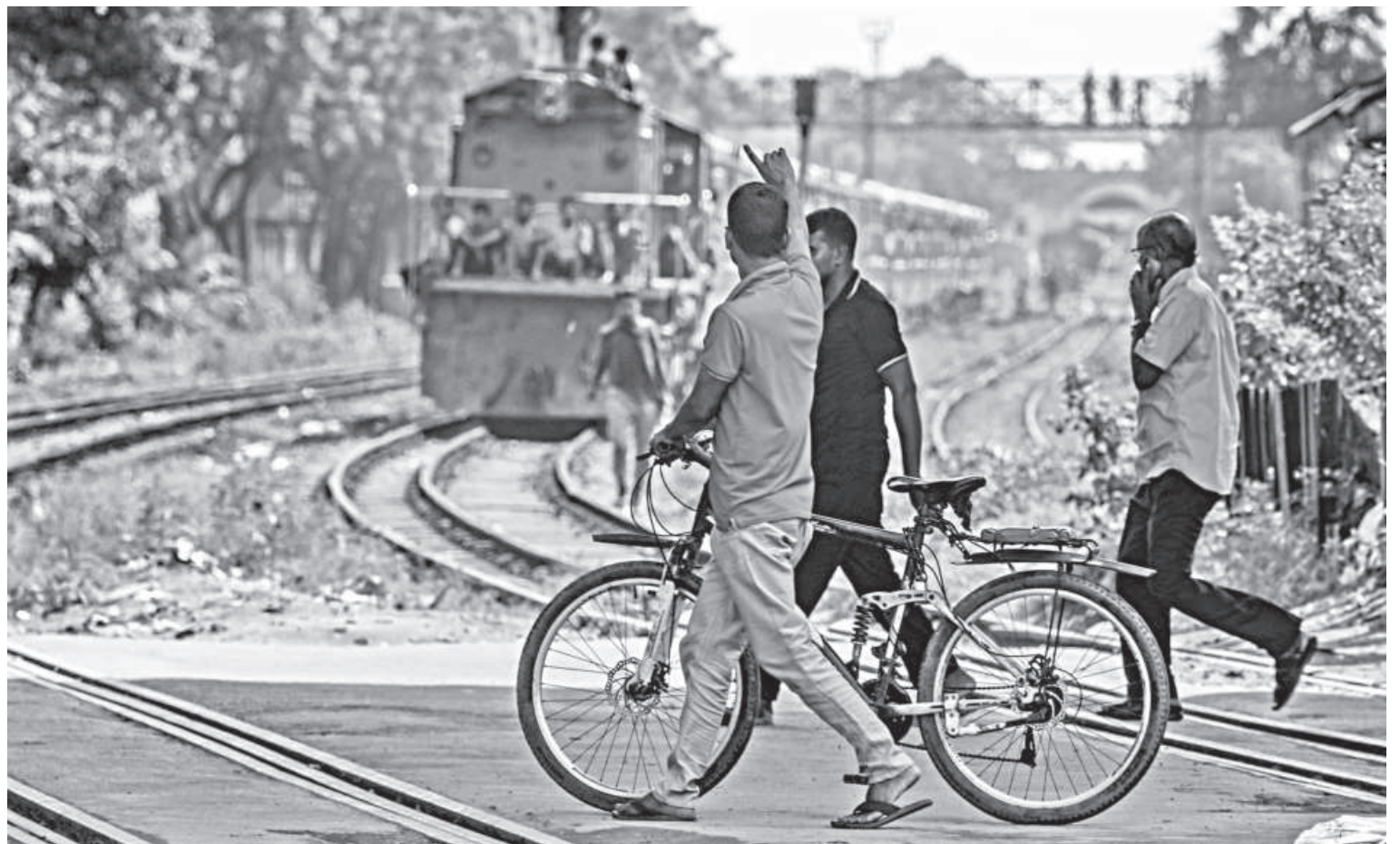
People casually stroll in front of a moving train at Khilgaon level crossing, a known high-accident-risk intersection in Dhaka, disregarding the danger. The photo was taken yesterday.