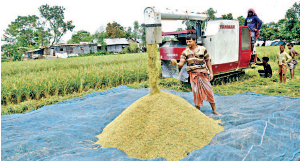
Farmers in Boalmari village of Char Asariada union in Rajshahi are harvesting half-ripe paddy. Much of the land in this area has been lost to the river, along with various trees and crops. Fearing further losses, farmers have begun harvesting whatever they can immediately.