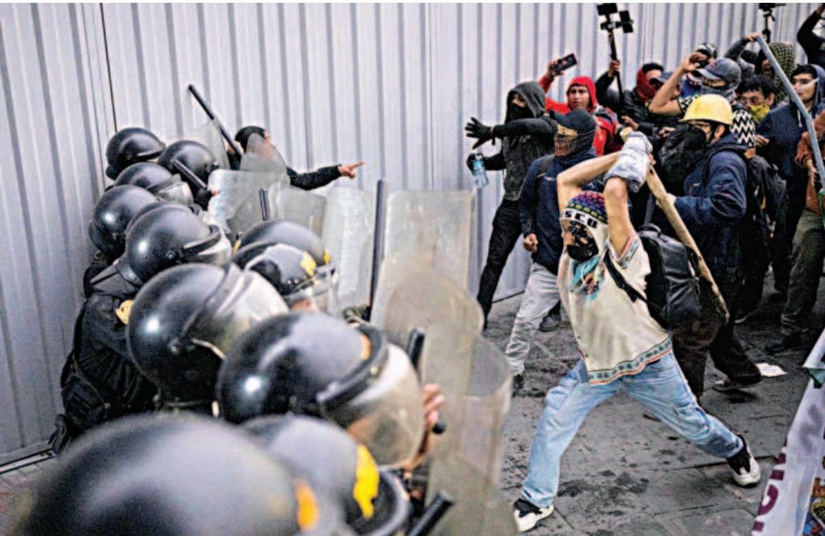
Protesters clash with riot police during an anti-government demonstration in Lima yesterday. The protest, organised by a youth collective called “Generation Z”, is part of growing social unrest in Peru against organised crime, corruption in public office, and a recent pension reform.

AFP, Kabul An Afghan government defence official yesterday said that a deal over Bagram air base was “not possible”, after US President Donald Trump said he wanted the former US base back. Bagram, the largest air base in Afghanistan located north of the capital Kabul, was the centre of US operations in their 20 year-war against the Taliban. Trump threatened unspecified punishment against Afghanistan if it was not returned. “If Afghanistan doesn’t give Bagram Airbase back to those that built it, the United States of America, BAD THINGS ARE GOING TO HAPPEN!!!” the 79-year-old leader wrote on his