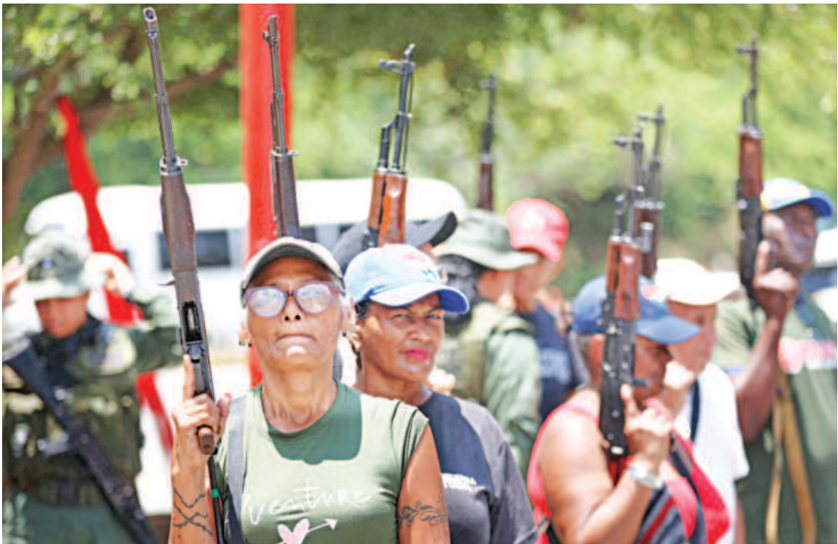
Members of the Community and Civil Councils hold rifles during a military training on weaponry at Fort Tiuna in Caracas on Saturday. Venezuela has started military training for civilians as US President Donald Trump threatened it with “incalculable” consequences if it refuses to take back migrants.

in-law, saying his son had been seriously injured in the strike. Israel said on Saturday its forces had expanded their operations in the Gaza City area over the past few days, killing 30 militants and locating weapons. Yesterday, witnesses said Israeli tanks were advancing towards the west through Tel Al-Hawa, a southeastern suburb. The Israeli military estimates that more than 450,000 people have left the city since the start of September. Hamas disputes this, saying just under 300,000 have left and that about 900,000 people remain. In southern Israel, air raid sirens sounded when Gaza militants fired two rockets across the border, one of which was intercepted and the other fell in an open field, the military said. No casualties were reported. The offensive has alarmed families of Israeli hostages still held by Hamas in Gaza. Twenty of those 48 captives are thought to still be alive. Thousands rallied on Saturday night outside Prime Minister Benjamin Netanyahu’s official residence in Jerusalem, calling on him to make a deal that will end the war and bring the hostages home.