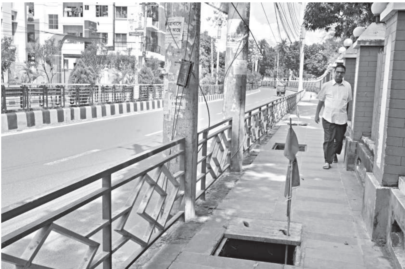
A man cautiously walks along a footpath in Rajshahi city, where multiple uncovered manholes pose a serious hazard. The theft of manhole covers from drains along footpaths has worsened the risk. While red flags mark some of the open drains, many footpaths in the city remain dangerous for pedestrians. The photo was taken yesterday.

Meanwhile, in Patuakhali town, a SEE PAGE 9 COL 1