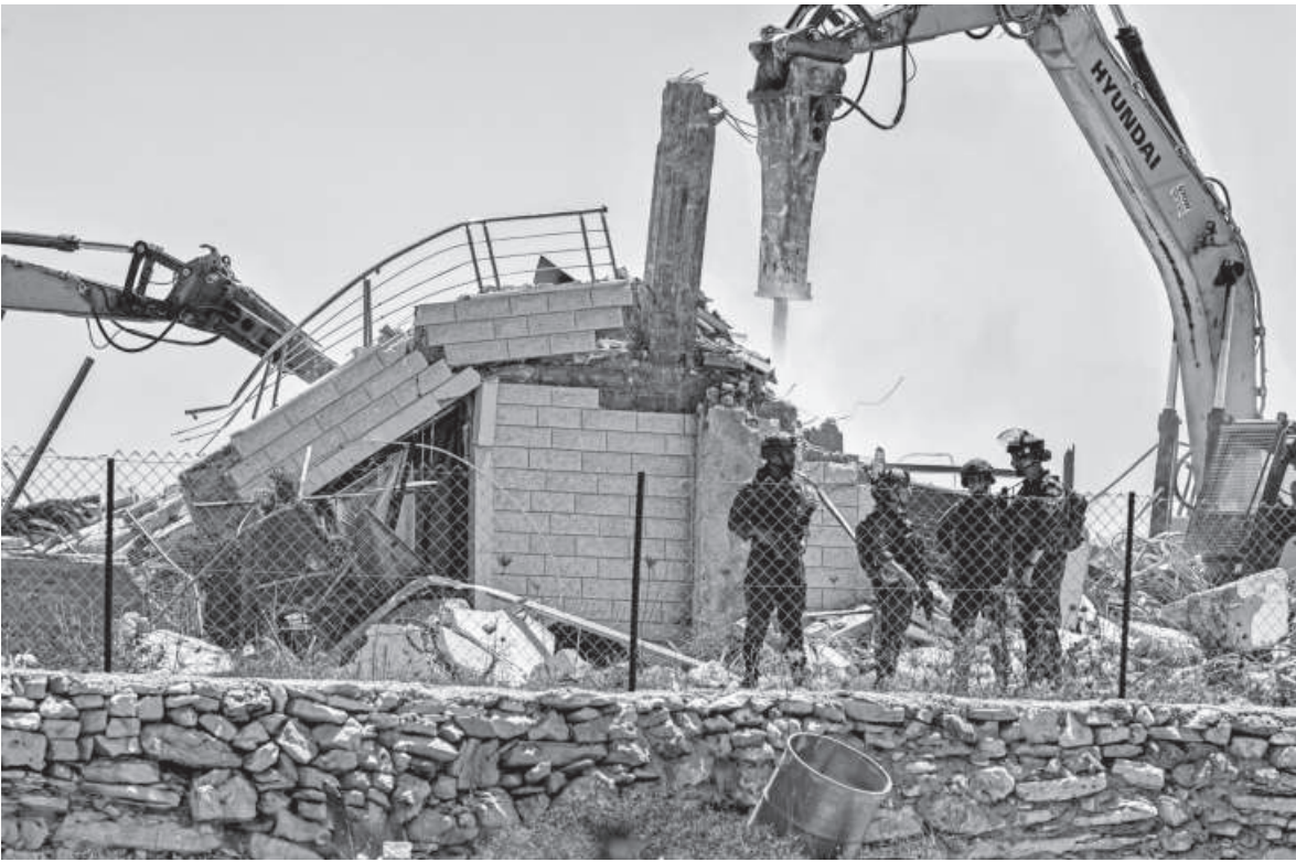
Israeli border guards stand by as excavators demolish a building in the village of Judeira, south of Ramallah in the occupied West Bank yesterday. The structure was reportedly built without a permit in Area C—territory designated by 1995 Oslo Accords as part of occupied Palestinian lands under full Israeli control.

“Russia is very attentive to the topic of nuclear non-proliferation. And we believe that everyone should be very, very cautious with nuclear rhetoric,” Kremlin spokesman Dmitry Peskov told reporters, including from AFP, yesterday. The row between Medvedev and Trump erupted against the backdrop of the US leader’s ultimatum for Russia to end its military offensive in Ukraine or face fresh economic sanctions. Medvedev accused Trump of “playing the ultimatum game” and said that Trump “should remember” that Russia was a formidable force.