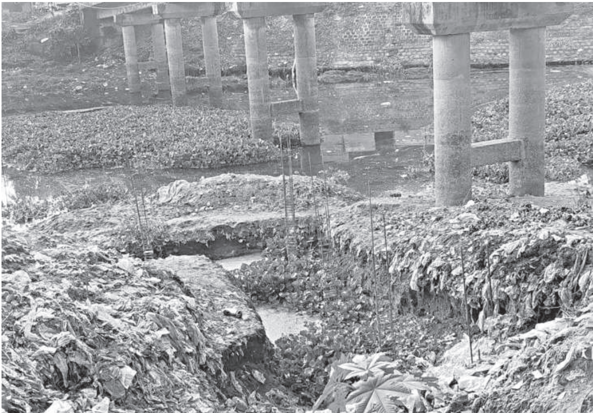
Once a lifeline for trade and travel, the Subarnakhali River now lies choked with waste and silence -- a forgotten waterway sacrificed to neglect, encroachment, and pollution. The photo was taken recently.

The authorities have approved a Tk 16 crore project, including drainage work, said Haque. “We are in the final stages of starting the project and expect to call for tenders this month,” he added.