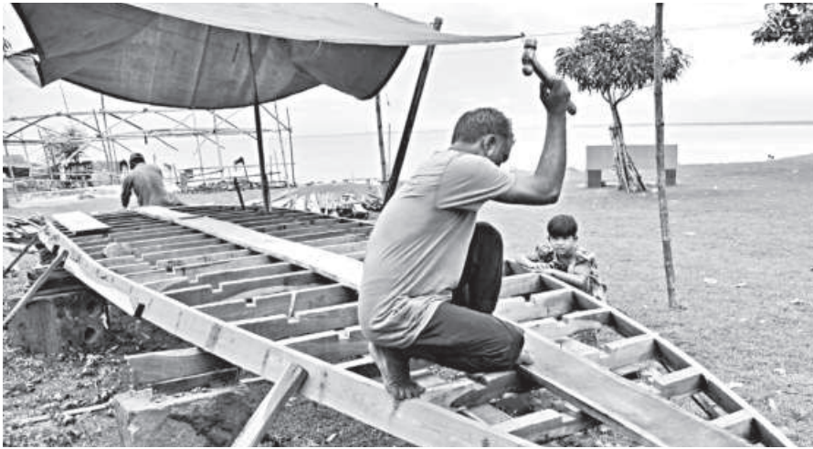
As the Padma River's water level rises in Rajshahi, fishermen spring back to life, busy building and repairing boats to set out with nets for fishing. The photo was taken yesterday.