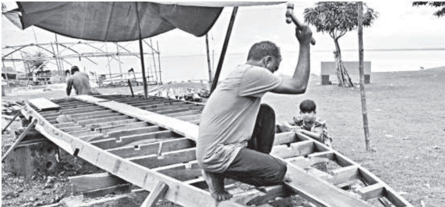
As the Padma River's water level rises in Rajshahi, fishermen spring back to life, busy building and repairing boats to set out with nets for fishing.