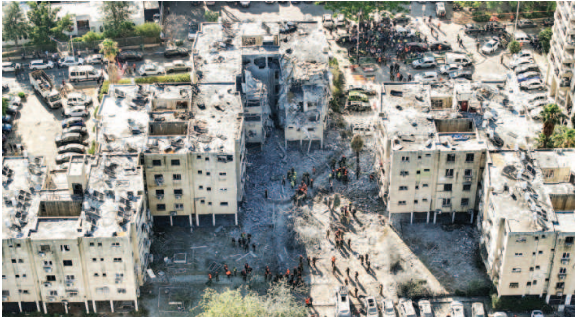
A drone photo shows the damage at the impacted site following a missile attack from Iran on Israel's Holon yesterday.