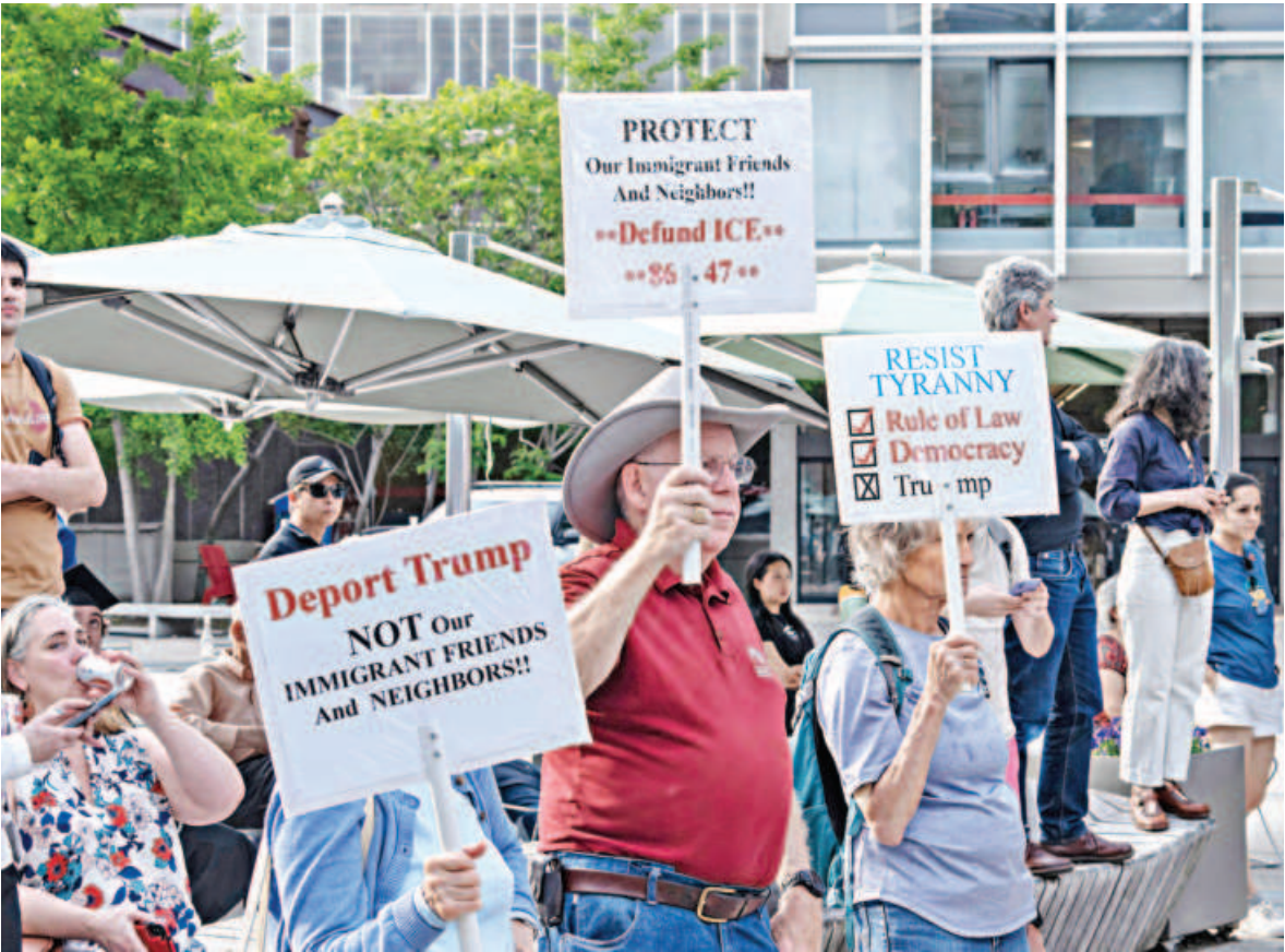
People hold signs during the Harvard Students for Freedom rally in support of international students at Harvard University in Boston, Massachusetts, on Tuesday.

Pakistan’s Foreign Office yesterday condemned the “inflammatory monologue” delivered by Indian PM Narendra Modi in Gujarat, urging India to “return to the core principles of international order”. The developments follow a recent military confrontation between India and Pakistan over New Delhi’s allegations against Islamabad, without evidence, about a deadly attack in Kashmir’s Pahalgam. In a video posted by Indian news outlet ANI, Modi, addressing India’s youth, calls into question the contents of the Indus Waters Treaty. He said, “If you study the 1960 Indus Waters Treaty, you’ll be shocked.” He continued, “It was decided that the dams built on the rivers of Jammu and Kashmir would not be cleaned... For 60 years, these gates were never opened. Reservoirs that were supposed to be filled to 100 per cent capacity have now been reduced to only 2pc or 3pc.” Stating that the treaty has only been held in abeyance as of now, he added, “Right now, I haven’t done anything, and people are sweating there [Pakistan].” Calling Modi’s remarks “unexpected”, Pakistan’s foreign office in its statement urged India to set aside its project of “historical revisionism”.