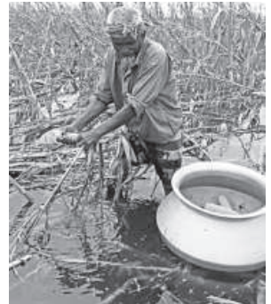
Relentless rainfall over the last one week left vast stretches of cropland submerged across Rangpur region, causing severe disruption to maize and paddy harvest.

The weather pattern is likely to persist until May 21, he said.