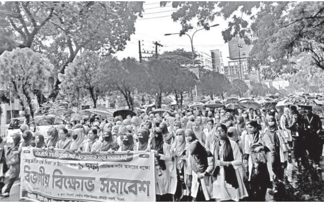
Hundreds of nursing students from various institutions across Sylhet gathered to stage a protest yesterday, marking International Nurses Day. They demanded that their three-year diploma in nursing and midwifery be recognised as equivalent to a bachelor's degree. The photo was taken from near the Sylhet Central Shaheed Minar.