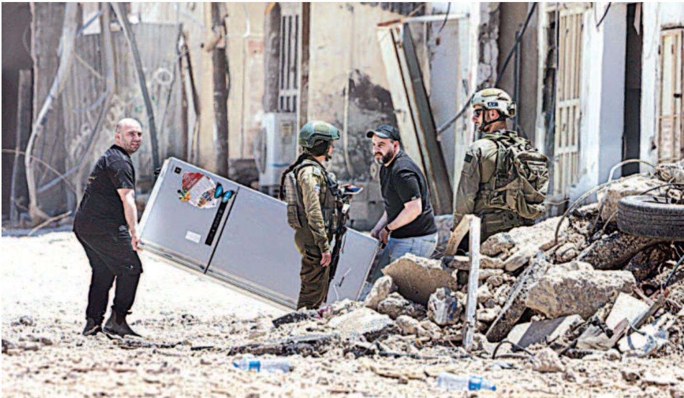
Palestinians carry their belongings after being forced to leave their house by Israeli forces during a raid in the Nur Shams camp for Palestinian refugees in the occupied West Bank yesterday.