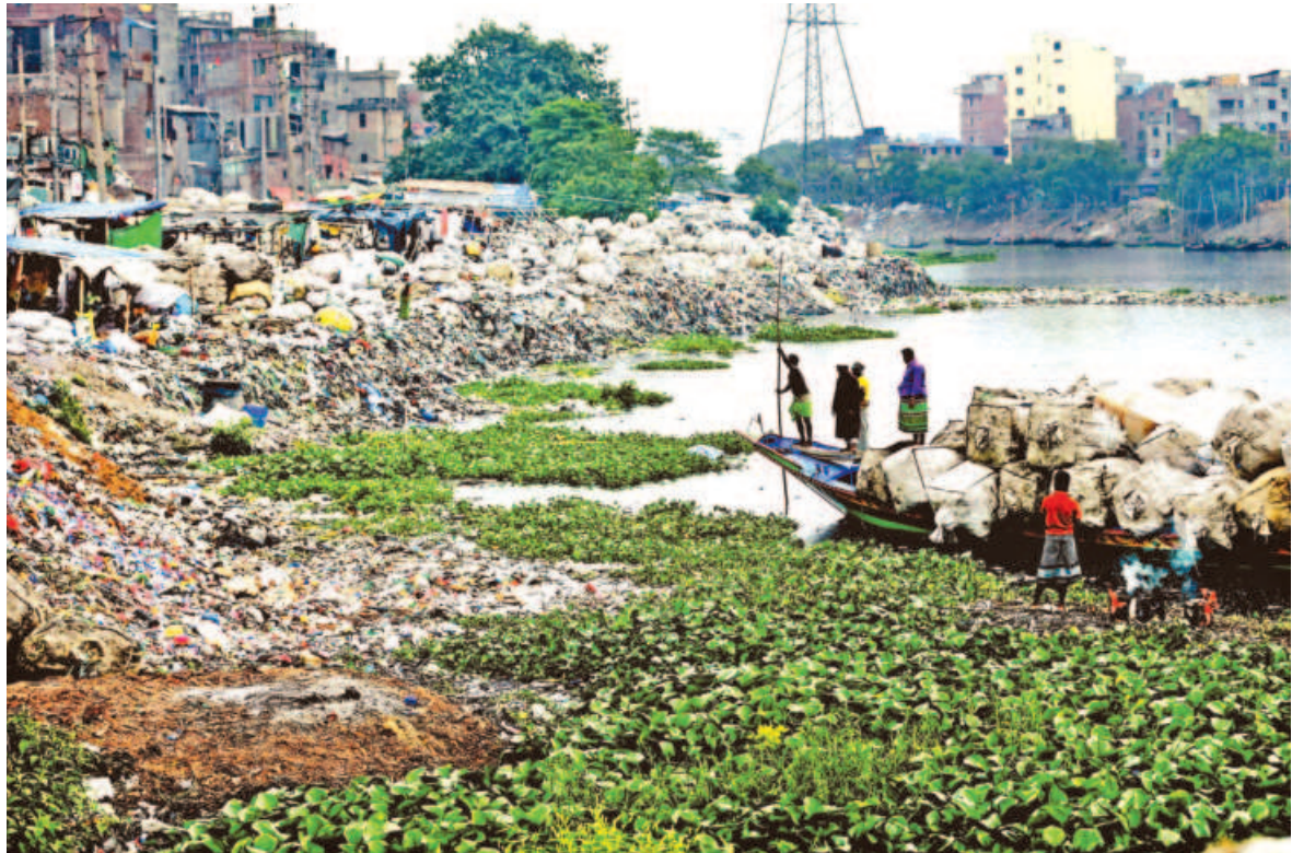
A boat-load of plastic waste arrives on the bank of Buriganga in Islambagh of the capital. Many businesses, mostly those that recycle plastic waste, operate in the area. They not only encroach on the banks, but also pollute the river.

» ICRC says Gaza aid should not be 'politicised'