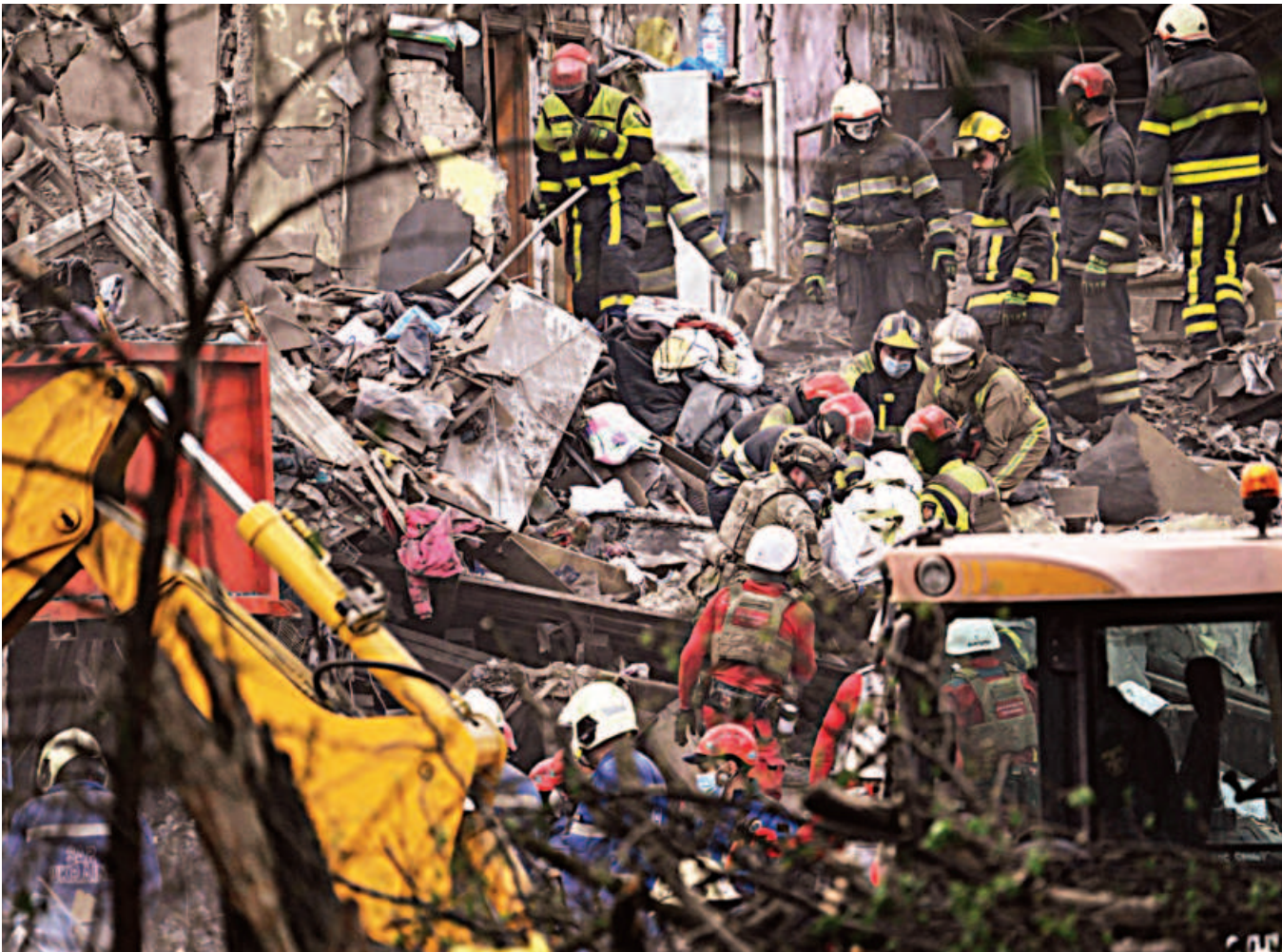
Ukrainian rescuers carry the body of a victim as they operate at the site of a Russian missile attack in Kyiv yesterday. A "massive" Russian missile attack on Kyiv killed at least nine and wounded dozens.

Pakistan warned that it would consider any attempt by India to stop the supply of water from the Indus River an "act of war and responded with full force across the complete spectrum of national power".