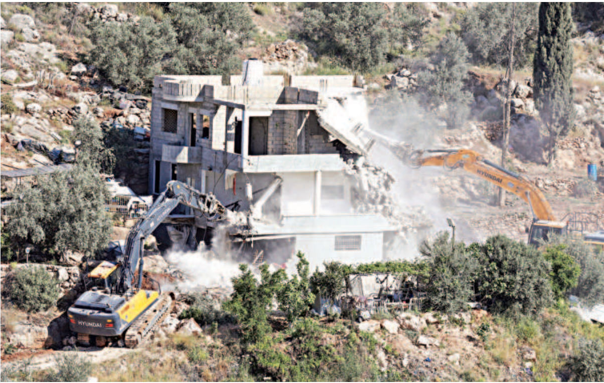
Israeli army excavators demolish two Palestinian buildings in Nilin north west of Ramallah in the occupied West Bank, yesterday. The buildings fall in the so-called Area C designated by the 1995 Oslo Accords, occupied Palestinian territory which remains under full Israeli control.

AFP, Gaza City Gaza’s civil defence agency yesterday accused the Israeli military of carrying out “summary executions” in the killing of 15 rescue workers last month, rejecting the findings of an internal probe by the army. The medics and other rescue workers were killed when responding to distress calls near Gaza’s southern city of Rafah early on March 23, days into Israel’s renewed offensive in the Hamas-run territory. Among those killed were eight Red Crescent staff members, six from the Gaza civil defence agency and one employee of UNRWA, the UN agency for Palestinian refugees, according to the UN humanitarian agency OCHA and Palestinian rescuers.