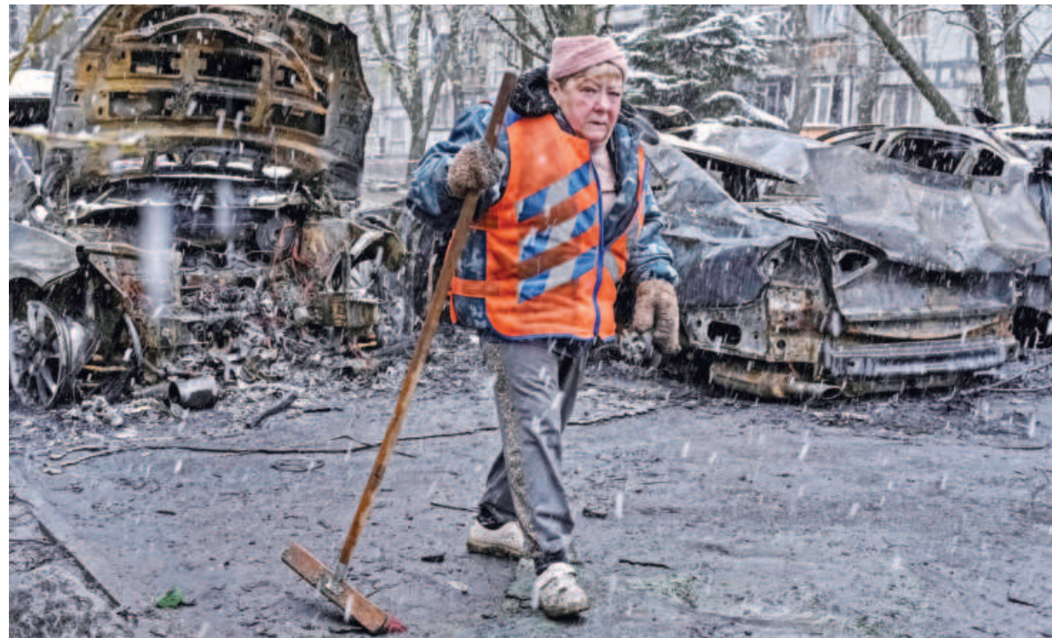
A municipal worker cleans an area at the site of a Russian drone strike in Dnipro, Ukraine yesterday. At least 21 Ukrainians were wounded during Russian attacks across the country overnight, regional officials said yesterday.