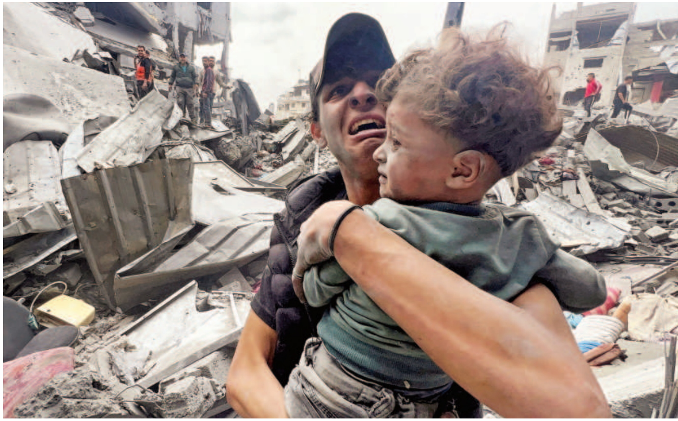
A Palestinian man reacts as he holds a child at the site of an Israeli strike in Shejaia in Gaza City yesterday.

A US court in 2013 acquitted Rana of conspiracy to provide material support to the Mumbai attacks. But the same court convicted him of backing LeT to provide material support to a plot to commit murder in Denmark.