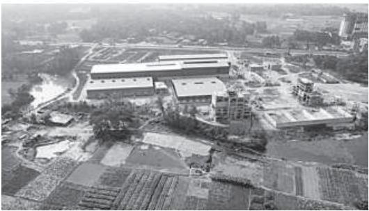
An excavator demolishing a structure built on the Karatoa river land in Bogura Sadar upazila. Tengamara Mohila Sabuj Sangha, a non-governmental organisation, allegedly grabbed 16.97 acres of the river land over the past three decades and set up various structures, inset. The local administration and the Water Development Board launched the eviction drive yesterday to free the river from encroachment.