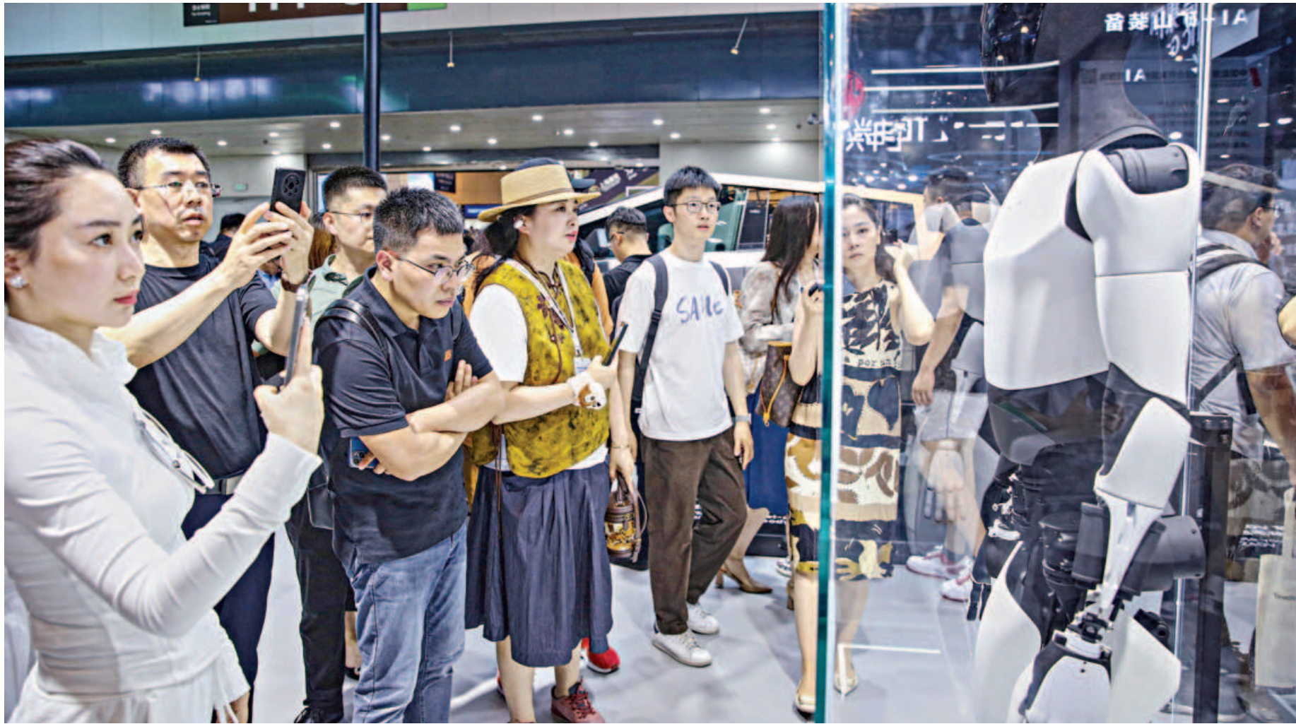
Visitors look at Tesla's humanoid robot Optimus at its exhibition booth during the World Artificial Intelligence Conference in Shanghai.