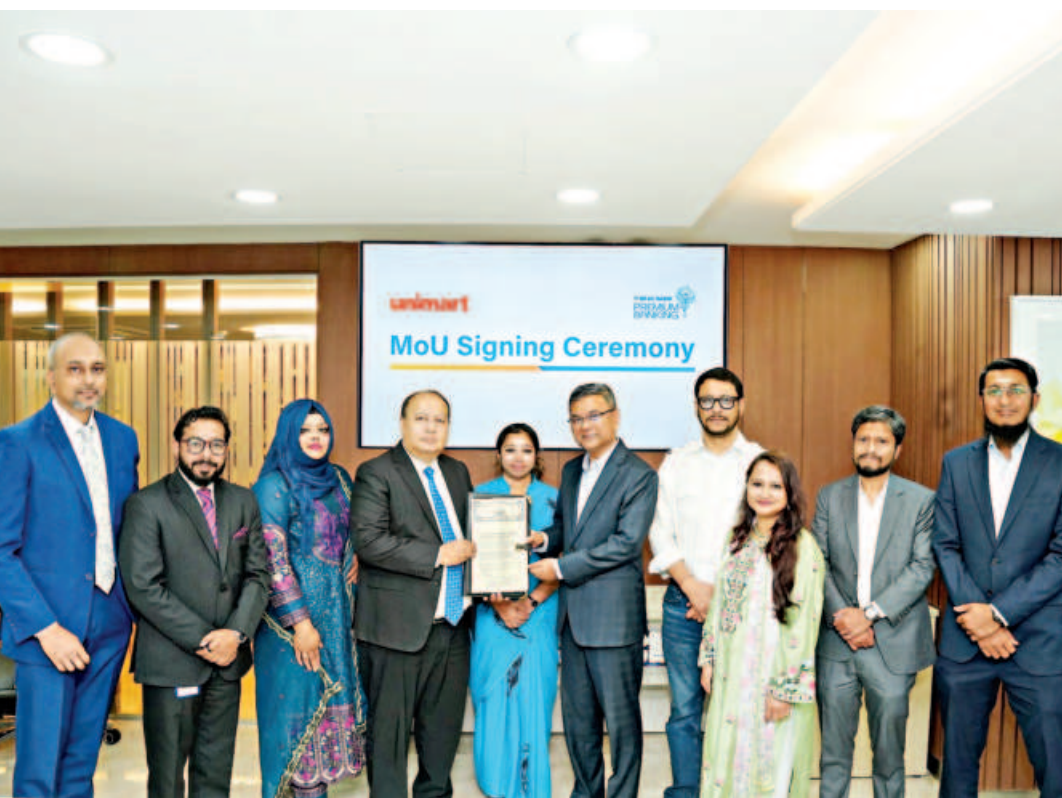
Officials of BRAC Bank and Unimart pose with the signed document at the bank's head office in the capital recently.

An MBA graduate from IBA, Dhaka University, he is also an NLP trainer and self-help educator, dedicated to youth empowerment.