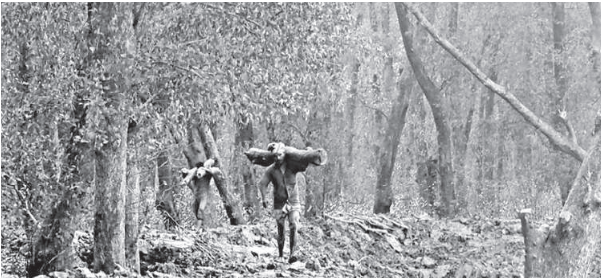
Workers carrying logs after cutting trees in the reserve forest in Majher Char under Patuakhali's Rangabali upazila. Due to unabated illegal logging, the forest is on the verge of disappearing.