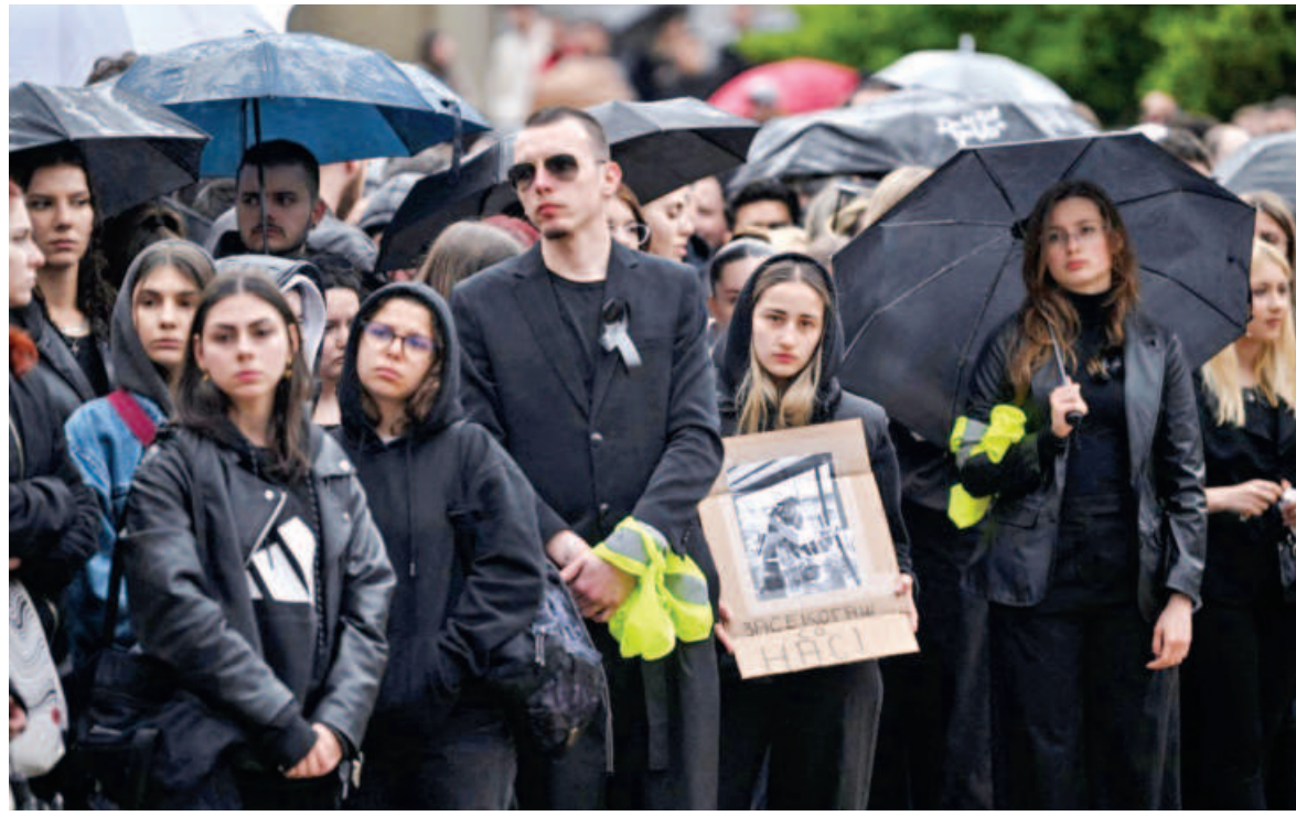
Students yesterday gather at the University of Skopje during a memorial ceremony a day after a fire tore through an overcrowded nightclub packed with mostly young people in North Macedonia killing 59 revellers in Skopje. Some 155 people who were injured in the inferno had been taken to hospitals across the country, 22 of them in critical condition, officials said.

Beijing called for "dialogue and negotiation" and a de-escalation of tensions.