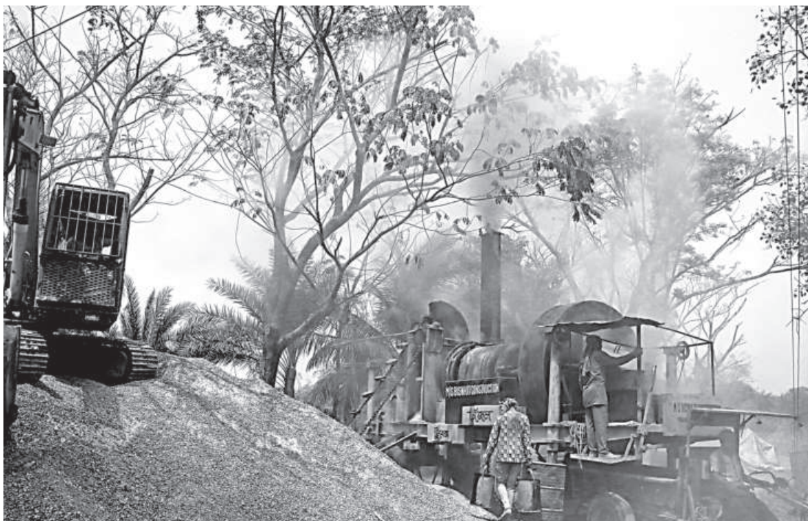
Dust and smoke from this stone and bitumen mixing machine are damaging the surrounding environment, particularly the trees. The machine has been set up for road repair works nearby. The photo was taken from Jashore yesterday.