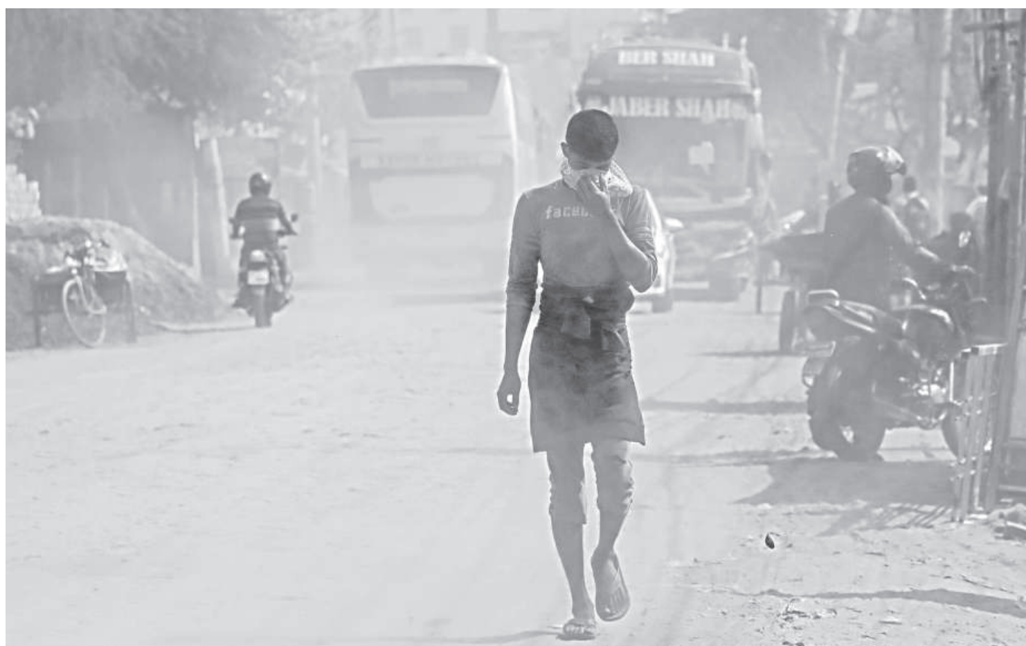
A pedestrian covers his face with a cloth while walking through a cloud of dust. Lack of maintenance has left this road in such a state that whenever vehicles pass, dust encompasses the entire area, leading to suffering for residents. The photo was taken from the Sonadanga Bypass Link Road in Khulna yesterday.

The directive came after a journalist, during a views-exchange meeting in Cox's Bazar, accused the OC of torturing journalists, repressing a woman, and being involved in a murder.