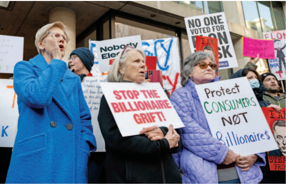
US Senator Elizabeth Warren, Democrat of Massachusetts, attends a protest rally against US President Donald Trump and Elon Musk's anticipated plan to close the Consumer Financial Protection Bureau in front of the CFPB headquarters in Washington, DC, on Monday.

“We believe that excessive regulation of the AI sector