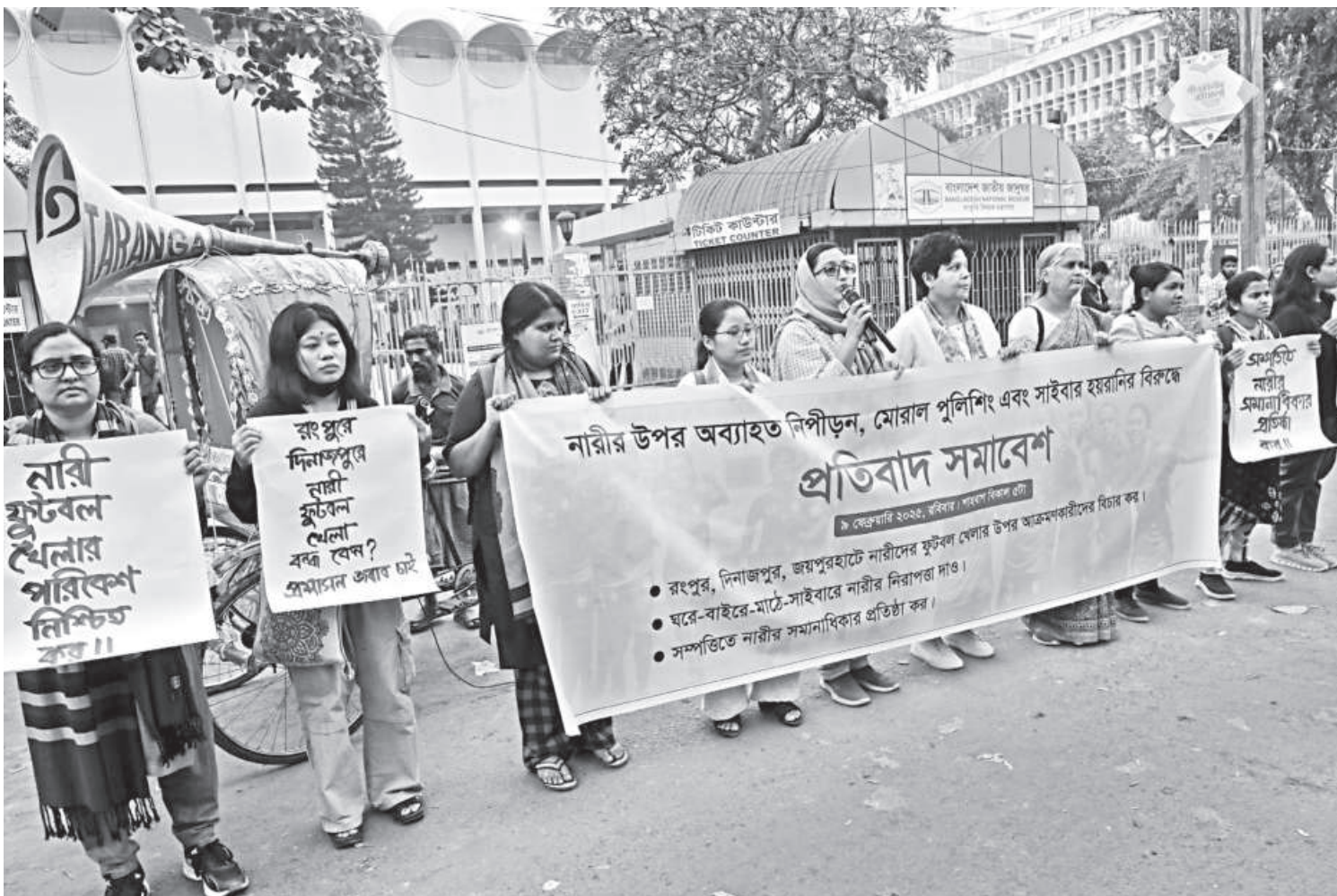
Activists protest the recent attacks and harassment against female footballers in the country, at a programme at the capital's Shahbagh yesterday. They demand an end to moral policing and the repression of women.