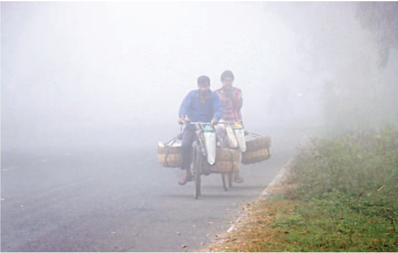
Gobinda and his companion cycle through the foggy winter morning towards Khulna city where they will sell fish. Every day, the two collect local fish from various villages and travel to the city to sell those. The photo was taken from the Bypass Road in the Beel Pabla area recently.