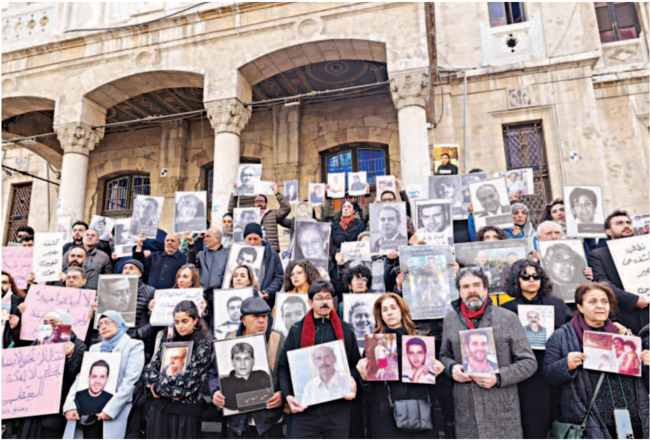
People hold portraits of missing relatives during a protest outside the Hijaz train station in the capital Damascus yesterday, calling for accountability for the perpetrators of crimes in Syria.

AFP, Jerusalem The Israeli military reported it conducted air strikes yesterday targeting “infrastructure” on the Syrian-Lebanese border near the village of Janta, which it said was used to smuggle weapons to the armed group Hezbollah. “Earlier today, the IAF (Israeli air force) struck infrastructure that was used to smuggle weapons via Syria to the Hezbollah terrorist organisation in Lebanon at the Janta crossing on the Syrian-Lebanese border,” the military said in a statement. It did not specify whether the strikes were on the Syrian or Lebanese side, but they came a day after Lebanon’s army accused Israel of “violation of the ceasefire agreement by attacking Lebanese sovereignty and destroying southern towns and villages”. There is no official crossing point near Janta but the area is known for illegal