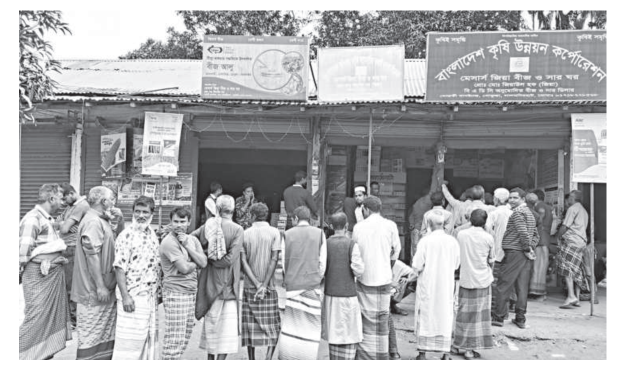
Farmers wait in line for hours to purchase fertiliser at a dealer's shop in Mostafi, Lalmonirhat Sadar upazila. The photo was taken recently.

The association urged government reconsider the proposal and ensure a collaborative approach to reform.