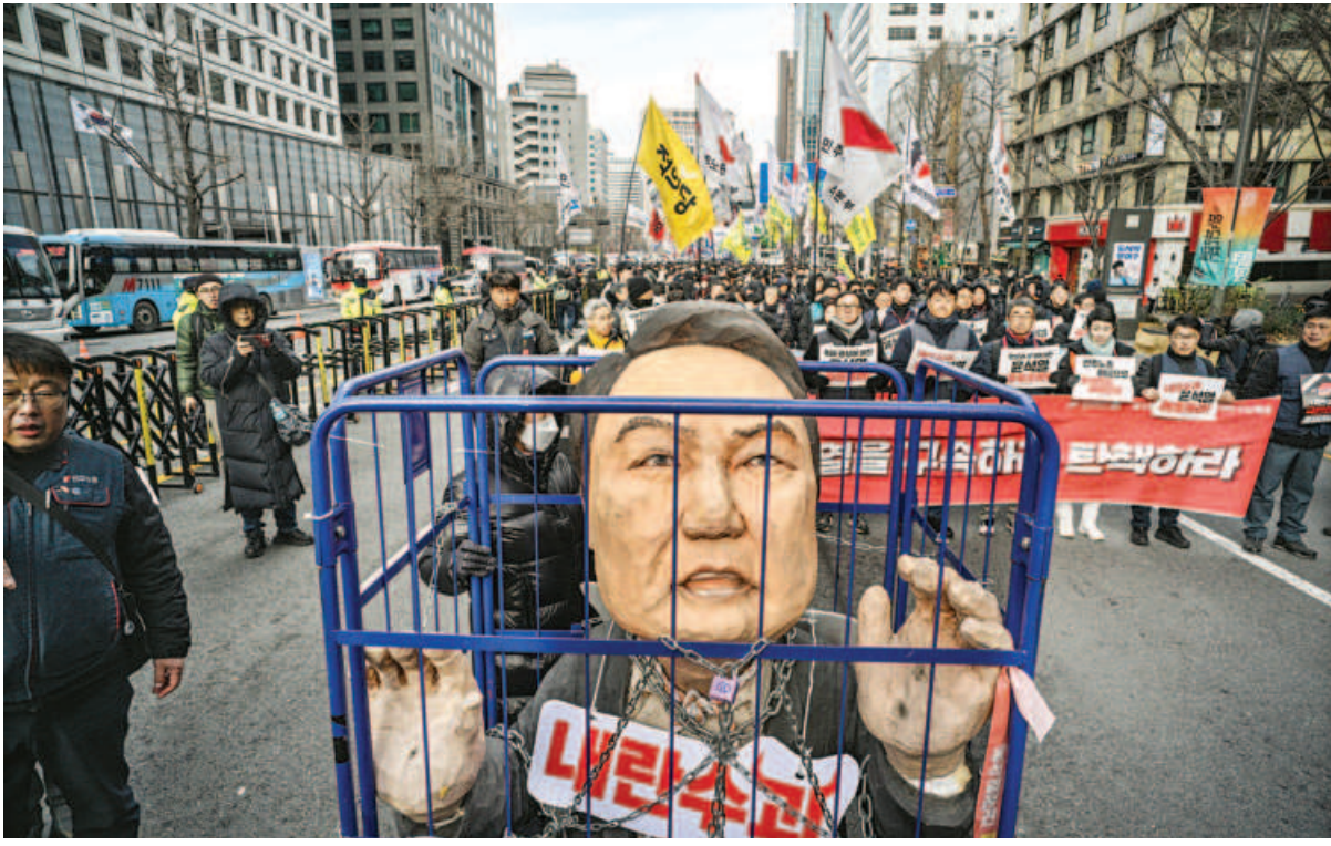
Demonstrators from a labour group take part in a protest calling for the ouster of South Korea President Yoon Suk Yeol outside City Hall in Seoul, South Korea yesterday. Yeol has vowed to fight "until the very last minute" in a defiant address defending his shock decision to declare martial law and deploy troops to the country's parliament last week.