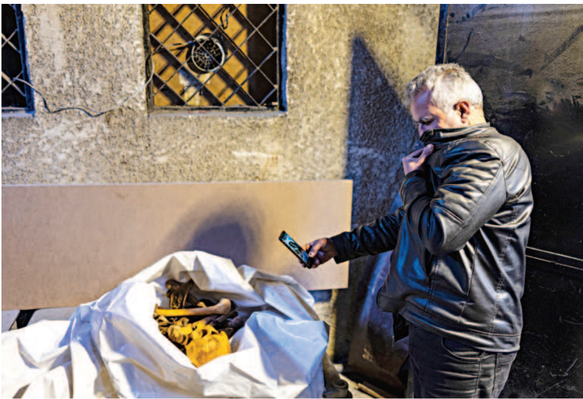
A man looks at the human remains in the morgue of Damascus Hospital in the Syrian capital yesterday, as people try to identify the bodies of relatives.

The guarded optimism emerges as US President Joe Biden's national security adviser Jake Sullivan held talks with Prime Minister Benjamin Netanyahu in Israel yesterday before heading to Egypt and Qatar, co-mediators with the US on a deal.