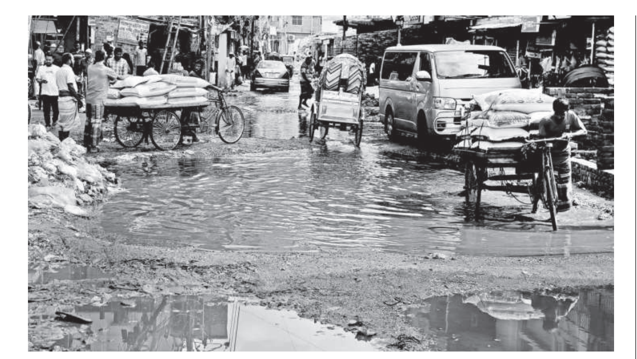
Water accumulates in these potholes whenever it rains or if the drain overflows. Following heavy rains earlier, these potholes were formed and are yet to be fixed. In the meanwhile, they continue to be a nuisance for pedestrians and vehicles. The photo was taken in the Manda area recently.