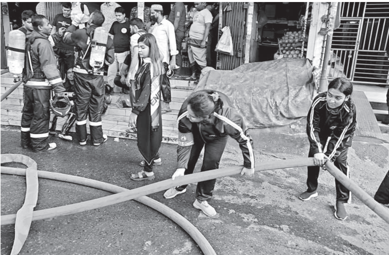
Female volunteers assist firefighters in extinguishing a blaze that erupted in the basement of a commercial-residential building near Tejgaon College in Farmgate, Dhaka, yesterday morning. The fire was brought under control within a few hours, with no casualties reported.