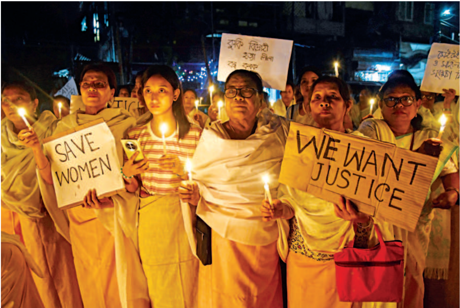
Women holding placards and candles take part in a demonstration in Guwahati, India yesterday, to condemn the alleged killing of women and children by militants in the Jiribam district of India's violence-hit northeastern state of Manipur.

UK-China relationship” while confronting Chinese President Xi Jinping over several contentious issues as the pair met yesterday. In the first bilateral meeting between a British prime minister and the Chinese leader since February 2018, Starmer told Xi the UK wanted “consistent, durable, respectful” bilateral relations. But he also warned that London was “committed to the rule of law”, in a nod to various disputes which have soured ties between London and Beijing in recent years. They include the case of British national Jimmy Lai, a media tycoon and pro-democracy activist imprisoned in Hong Kong, whose case Starmer raised directly with Xi.