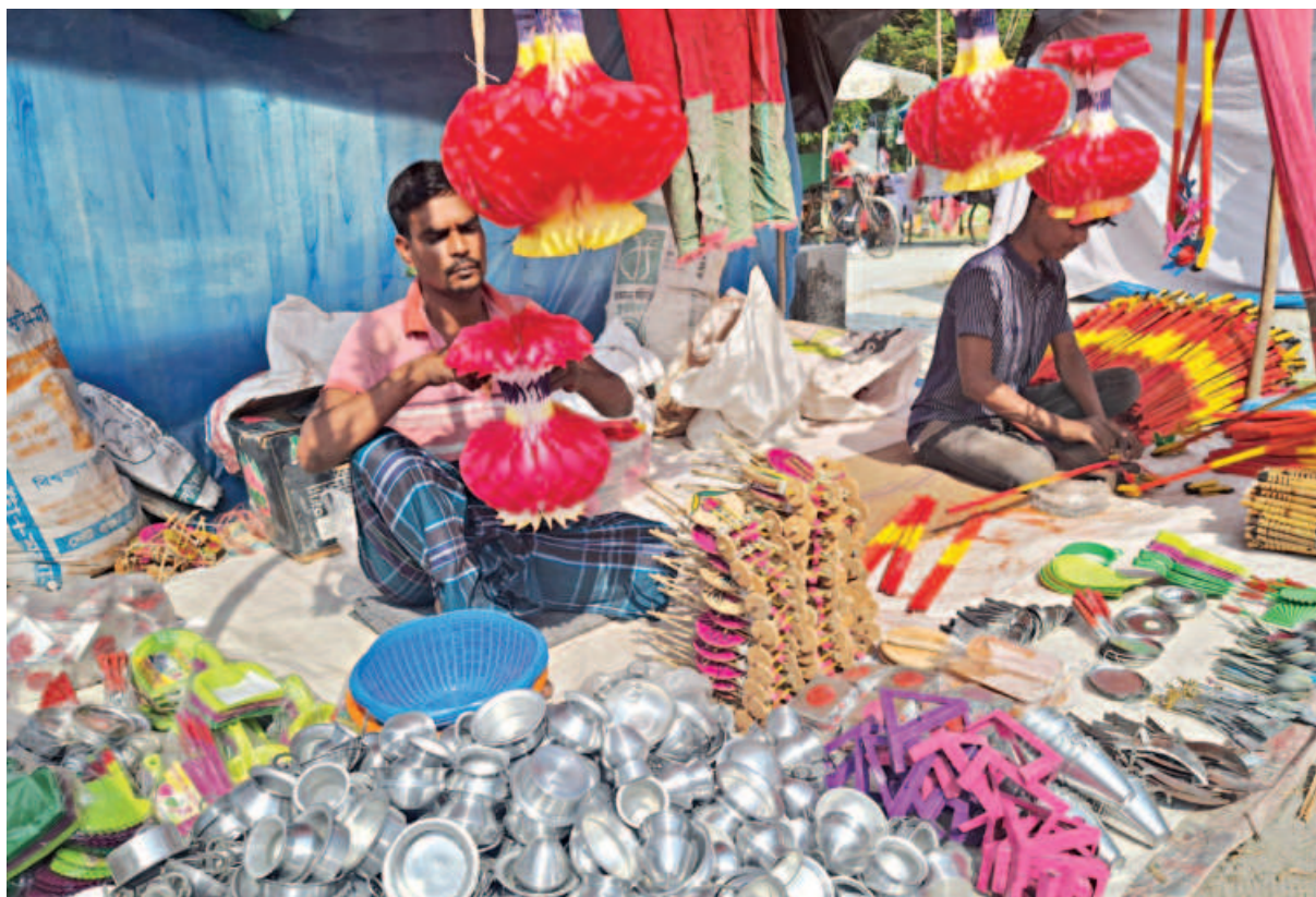
Sellers at a stall during a traditional village fair marking the beginning of the Bangla month of Agrahayan in Barishal. The photo was taken at Kurapur in Sadar upazila yesterday.