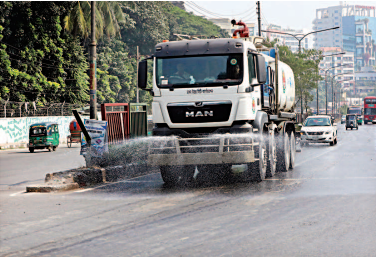
A Dhaka North City Corporation vehicle sprays water on the road in an effort to reduce dust. The photo was taken in the capital's Kalyanpur yesterday.