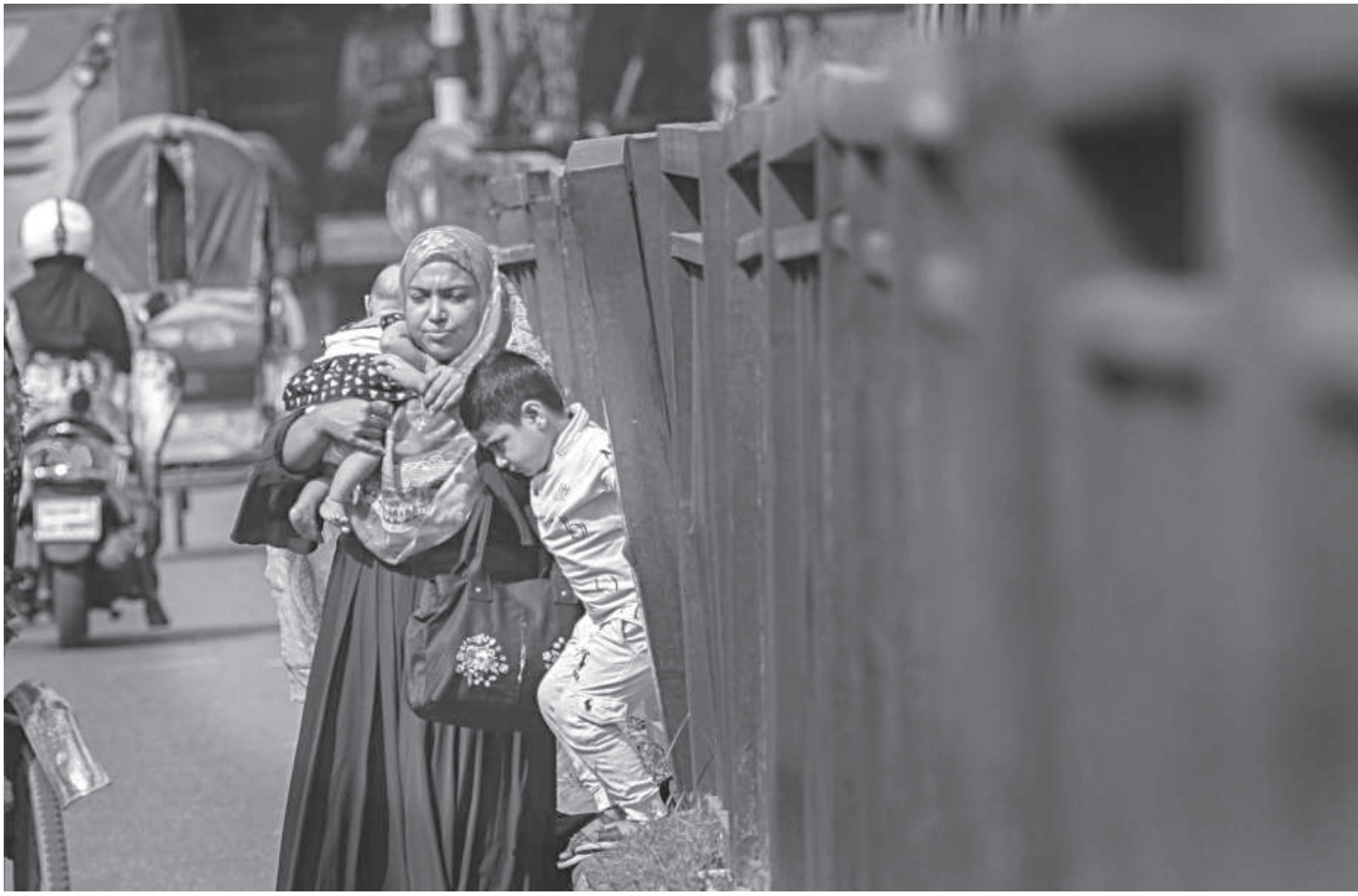
Holding a newborn in one arm and another child's hand in the other, a woman crosses a road through a section of a broken divider. Vehicles rush by as she helps her son get down from the median. While such actions might save a few minutes, it can also lead to a disaster. The photo was taken in Dhaka's Azimpur area recently.