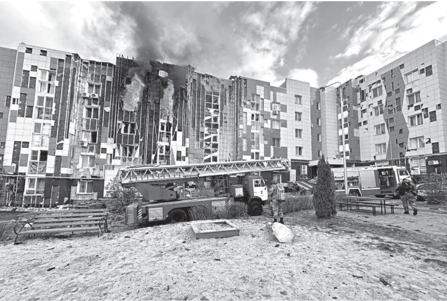
The photo shows a damaged multi-storey apartment block following, what local authorities called, a Ukrainian drone attack in the course of Russia-Ukraine conflict in Belgorod, Russia yesterday.

The International Organization for Migration (IOM) said at least 25 people were killed and only five survived the sinking, the latest on a well-known route to smuggle people to Mayotte. Among the survivors was a 19-year-old Comorian who said he only made it through because he knows how to swim.