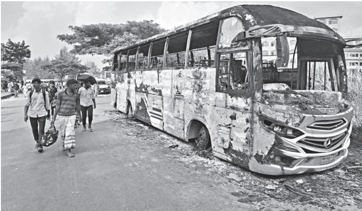
Students of Barishal University set fire to this bus in front of the institution on Wednesday night, after a BU student was killed by a Narayanganj Paribahan bus the same day. The burnt carcass of the bus was not removed from the spot till yesterday.

Colonel Malik Medical College in Manikganj has been renamed as Manikganj Medical College, Abdul Malek Ukil Medical College in Noakhali as Noakhali Medical College, and Sheikh Hasina Medical College in Jamalpur as Jamalpur Medical College, Sheikh Hasina Medical College in Tangail renamed as Tangail Medical College, Bangabandhu Sheikh Mujib Medical College in Faridpur as Faridpur Medical College, and M Abdur Rahim Medical College in Dinajpur as Dinajpur Medical College, said the circular.